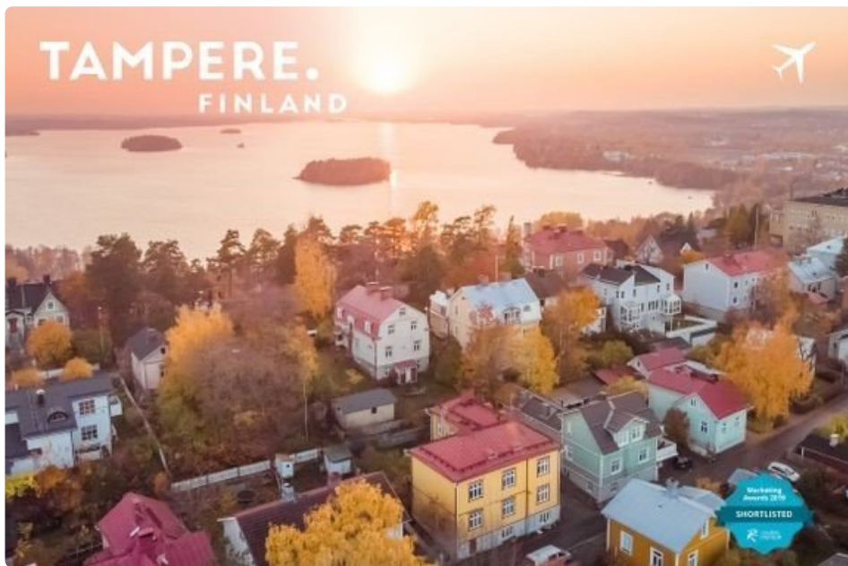
Tampere on näyttänyt mainetta suosittuna matkakohteena Euroopassa.