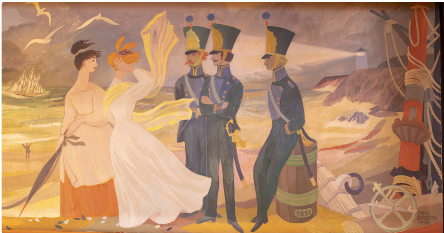
Kuvat: Haminan kaupunki/Jarno Koivula. - Kuvassa Haminan kaupungin 300-vuotisjuhlinsa Seurahuoneen Marski-kabinettiin vuonna 1952 tilaamansa suurteokset.