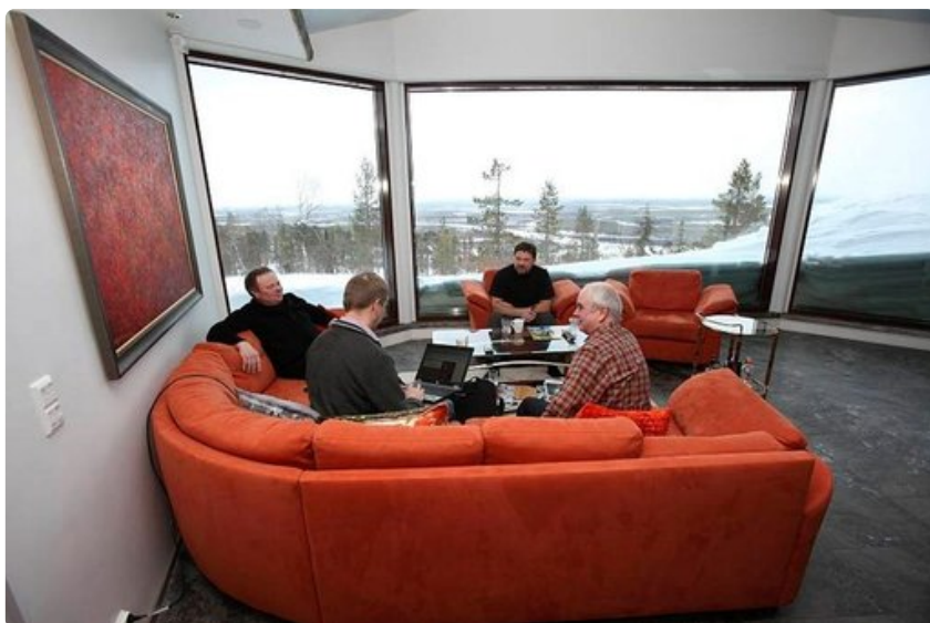
Neuvottelun väliillä ajatuksen kirkastuvat...