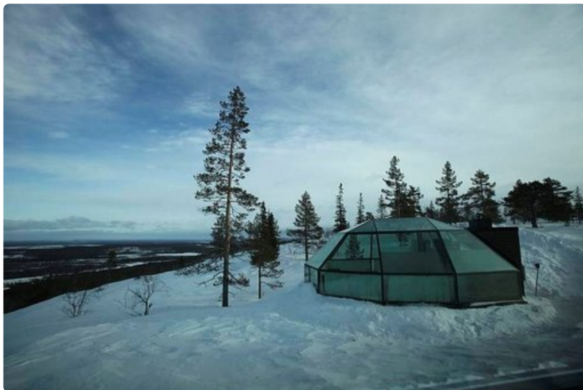
Utsuvaaran rinteeseen rakennetut lasi-iglut sijaitsevat komeissa maisemissa.