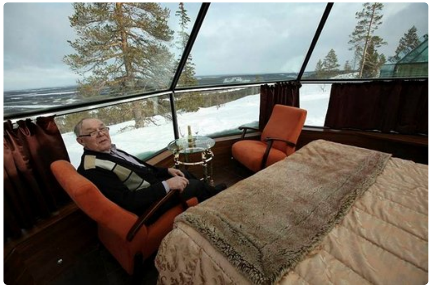
Levin iglut ovat syntyneen Tauno Mäkelän ideasta.