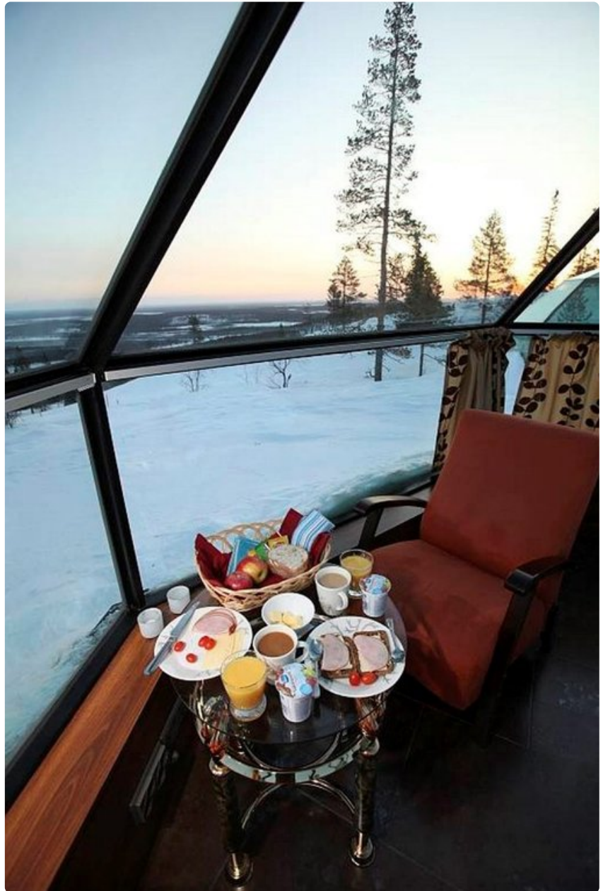
Aamiaisella ihailaan auringonnousua.