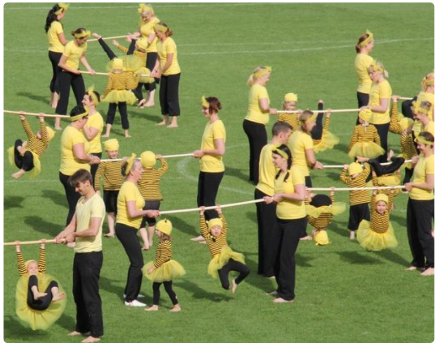
Myös lapset esiintyivät yhdessä aikuisten kanssa.