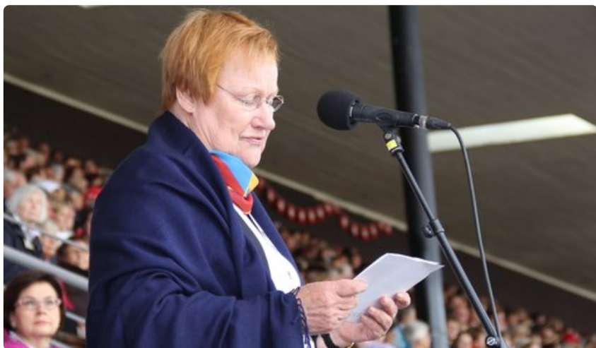
Presidentti Tarja Halonen avaamassa Gymnaestrada-voimistelujuhlaa.