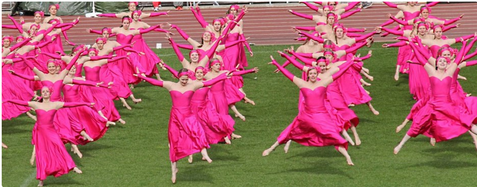
Esiintymisissä riitti myös vauhtia.