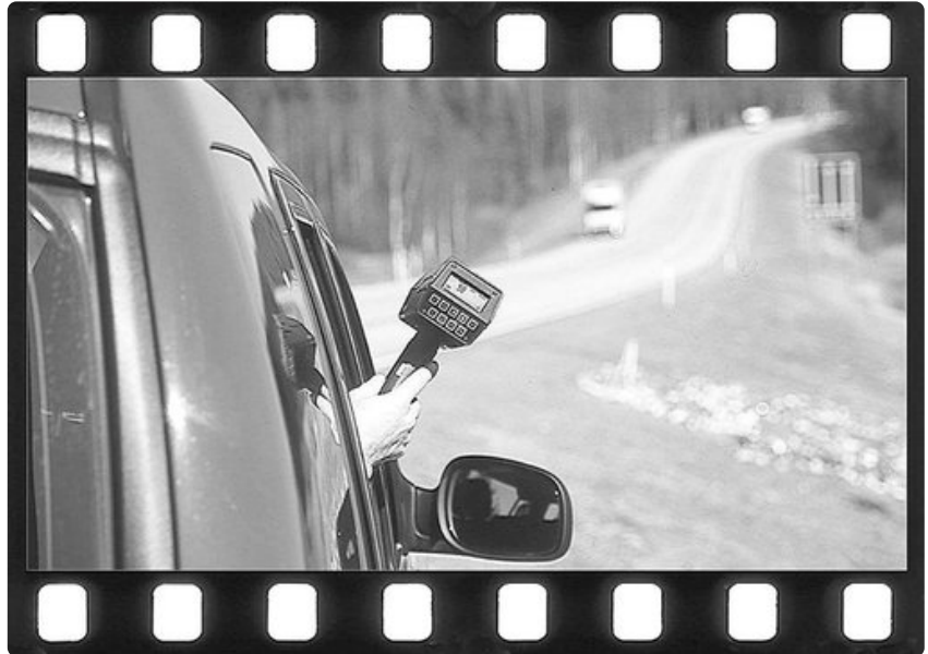
Ylettömät ylinopeudet puhuttavat suomalaisuuden arvioitsijoita.