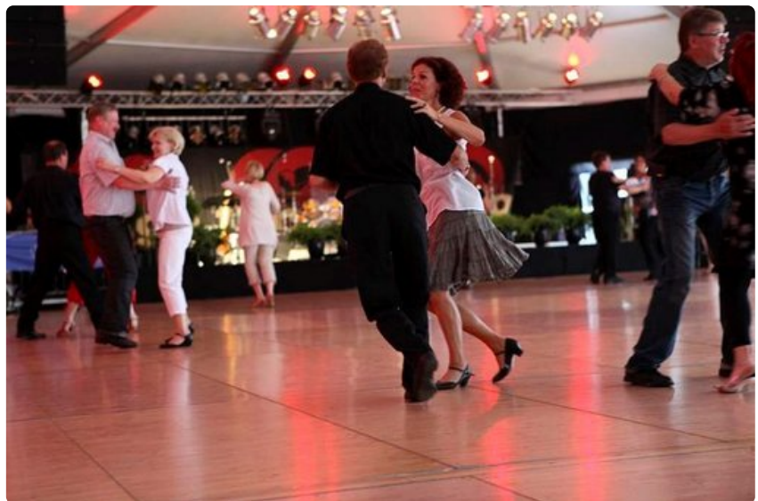
Suomi ja tango. Tätä ovat Seinäjoen tangomarkkinat.