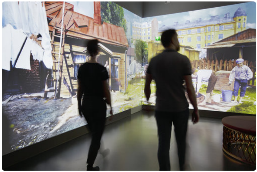
Huhtikuussa 2019 kaupunginmuseossa avataan virtuaalielämys Aikakoneen uusi versio 2.0. Aikakoneessa Signe Branderin sadan vuoden takaiset valokuvat heräävät eloon uuden teknologian avulla.

Huhtikuussa museossa avataan myös virtuaalielämys Aikakoneen uusi versio 2.0. Aikakoneessa Signe Branderin sadan vuoden takaiset valokuvat heräävät eloon uuden teknologian avulla.