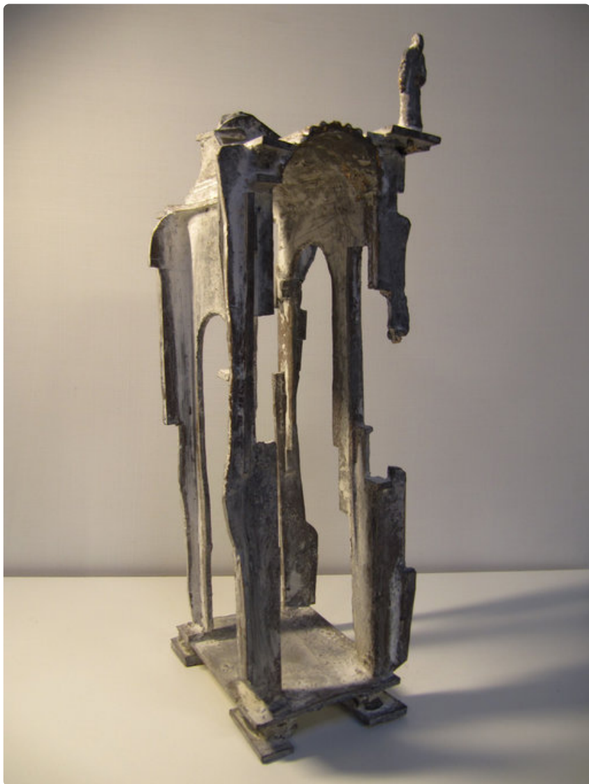
Pekka Rytkönen:Filosofi, pronssi ja marmori.