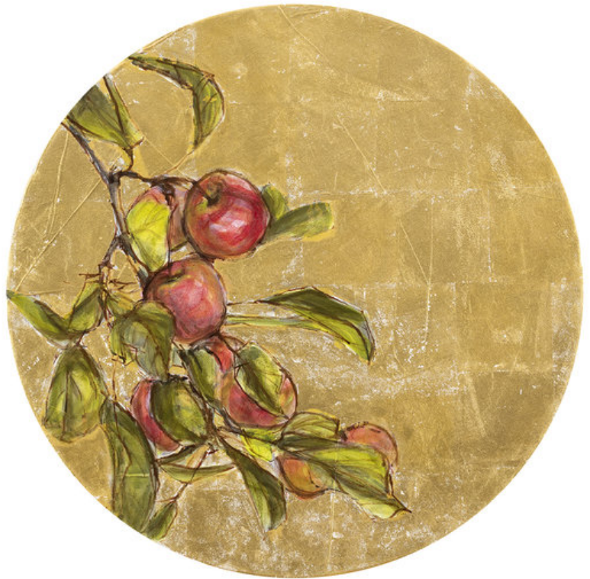
Tero Annanolli: Aamun Tuoksu II, tussi, öljy, lehtikulta kankaalle, 2018

oli yksi Suomen modernistisen kuvanveiston ehdottomia mestareita. Pullisen tuotannolle on ollut tunnusomaista plastisen muotokielen perinteiden kunnioittaminen, vaikka hän on samalla saattanut