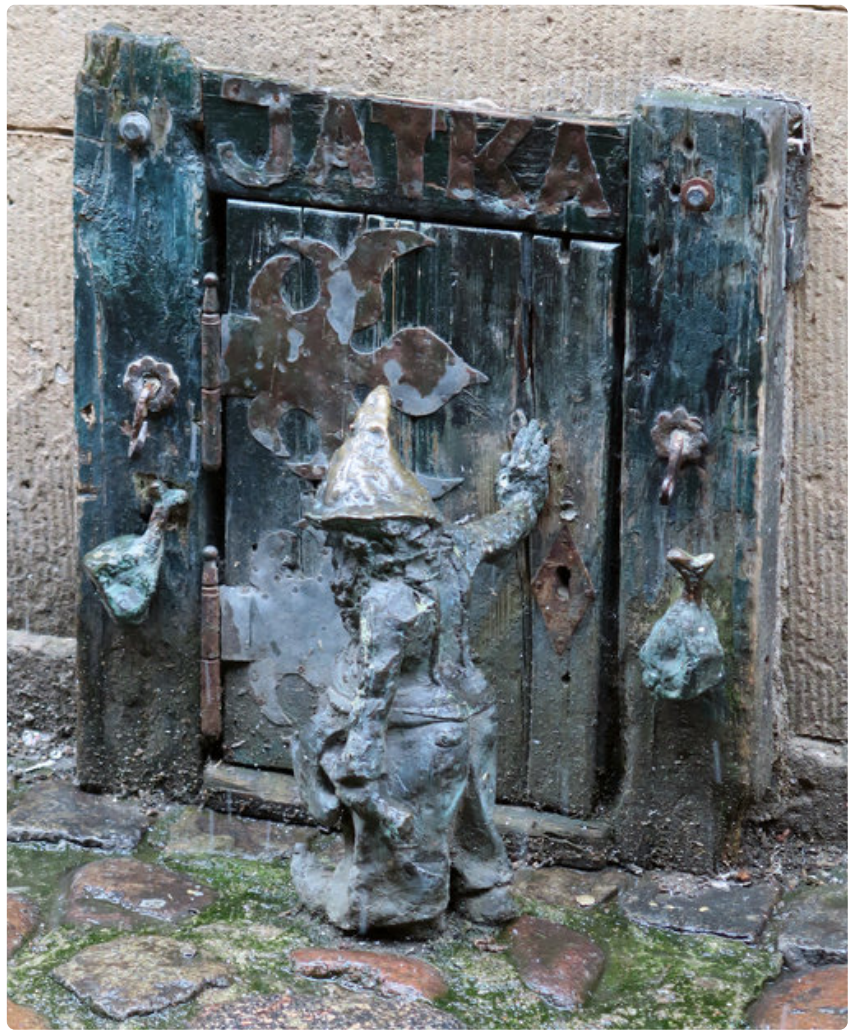
Tonttu ovelle kolkuttaa.