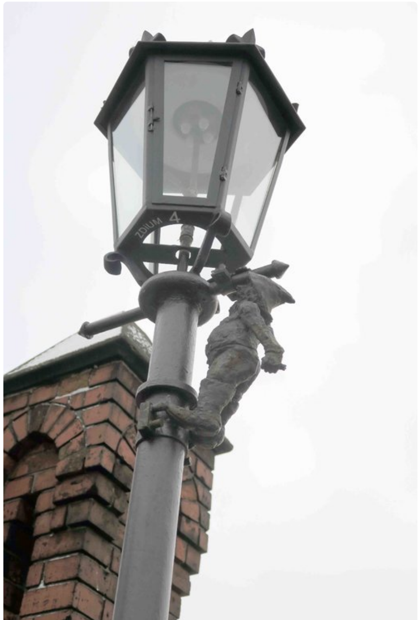
Lyhdynsyyttäjätonttu on kiivennyt pylvään päähän.