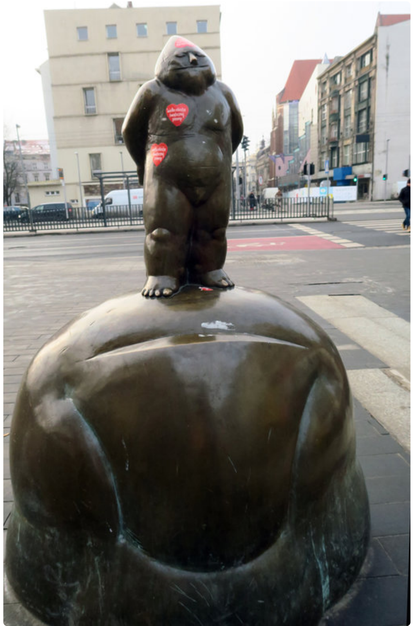
Ensimmäinen, pulleamuotoinen tonttu pystytettiin vuonna 2001 Kulttuuripääkaupunkivuoden infopisteenä toimivan BarBaran viereen.