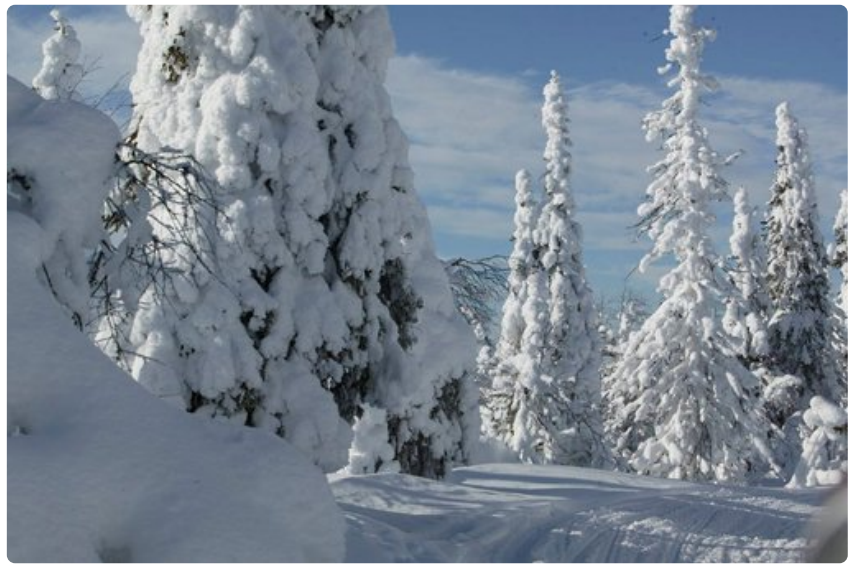
Lapin talvi ja Helsinki ovat kohteina, kun Finnair ja kiinalainen verkkoyritys alkavat myydä Suomen talvea.