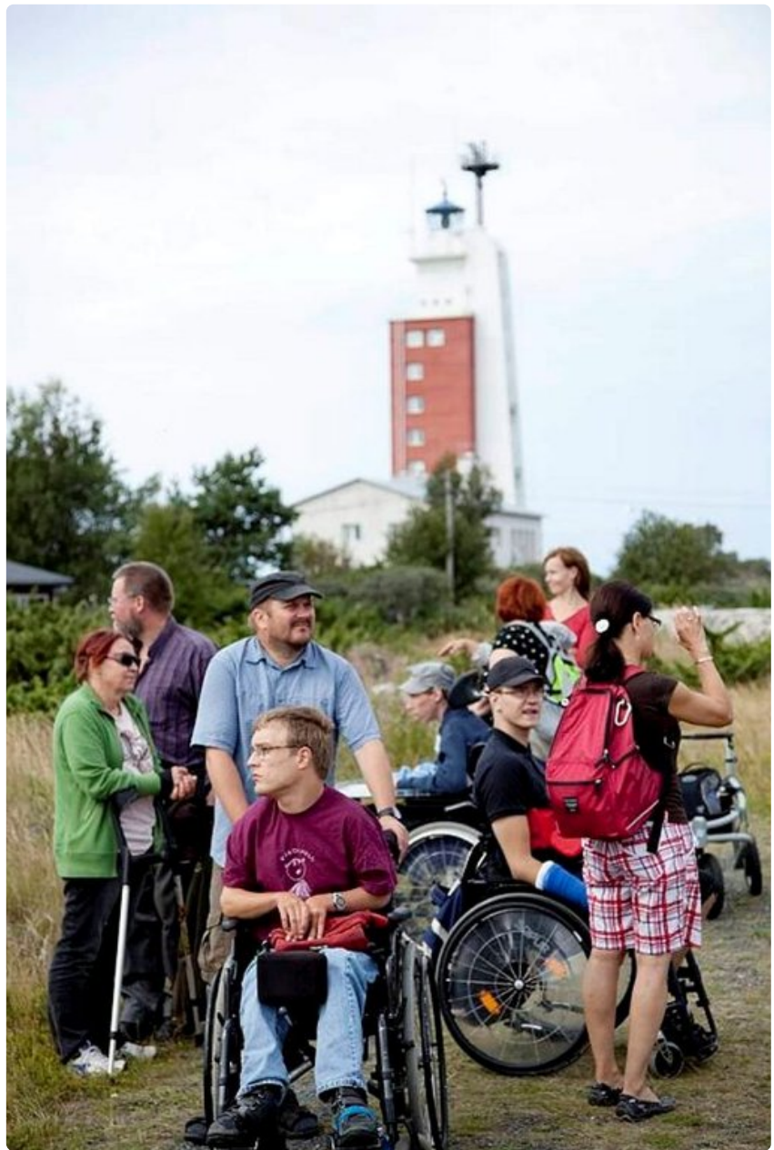
Testiryhmä on juuri astunut maihin Kylmäpihlajassa.