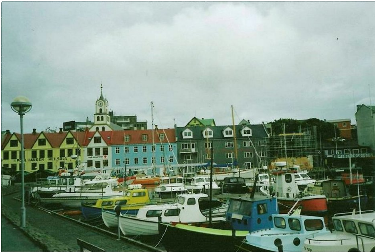
Torshavnia, Färsaarten pääkaupunkia, koristavat värikkäät talot sekä sataman veneet ja alukset.