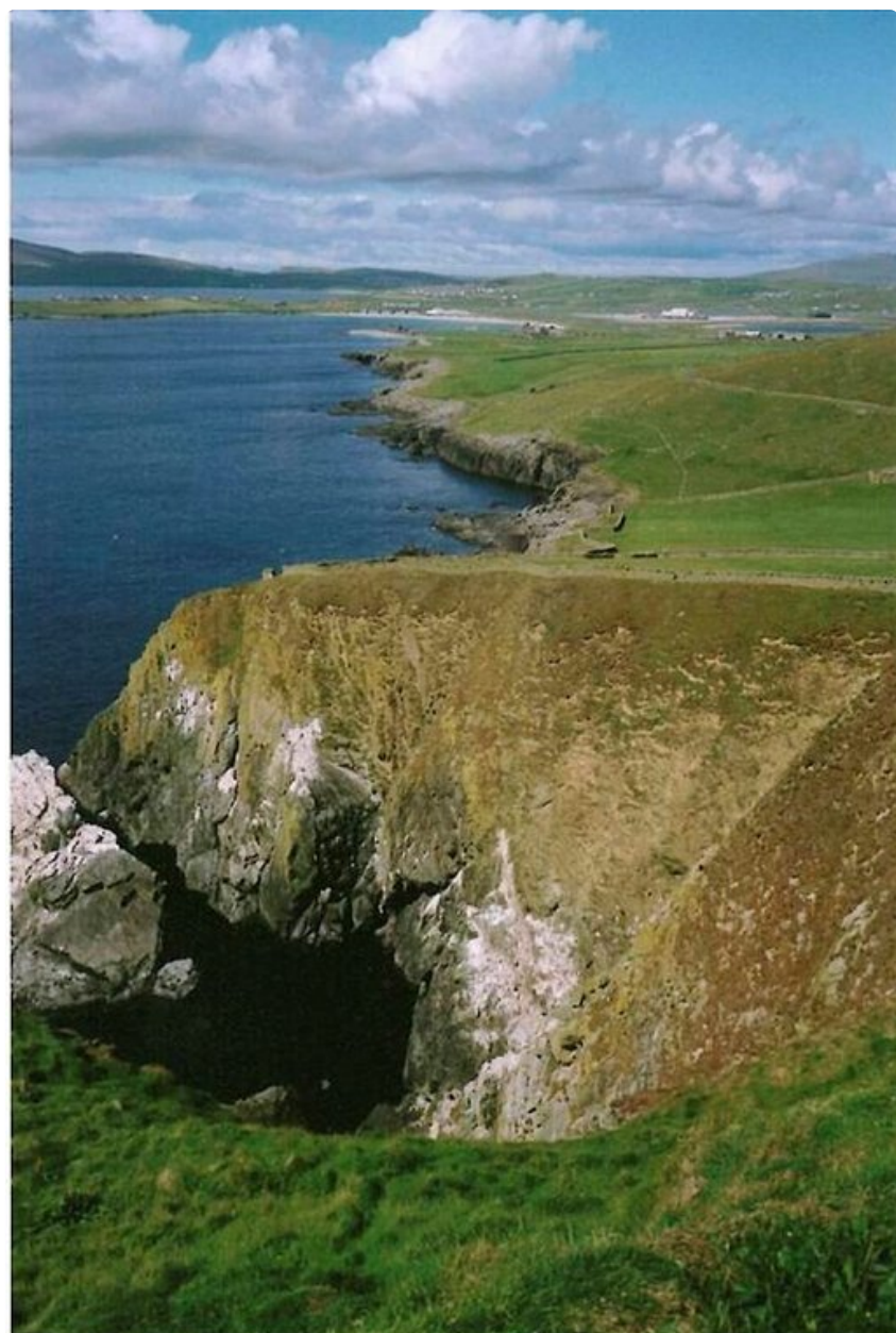
Karunkaunista rikkonaista rannikkoa Sumburgh Headin lähellä Shetlandinsaarella.