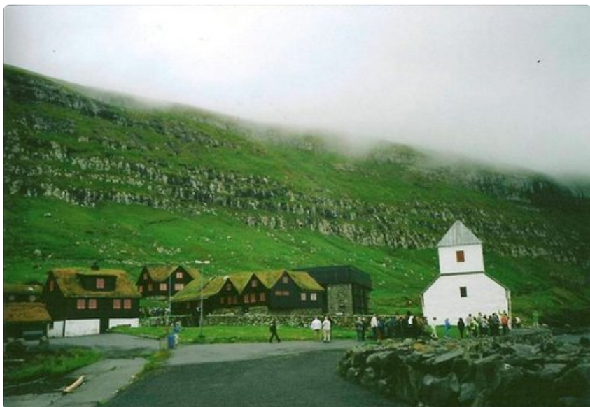
Kirkjubourin heinäkattotaloja ja Valkeakirkko 1000-luvulta.