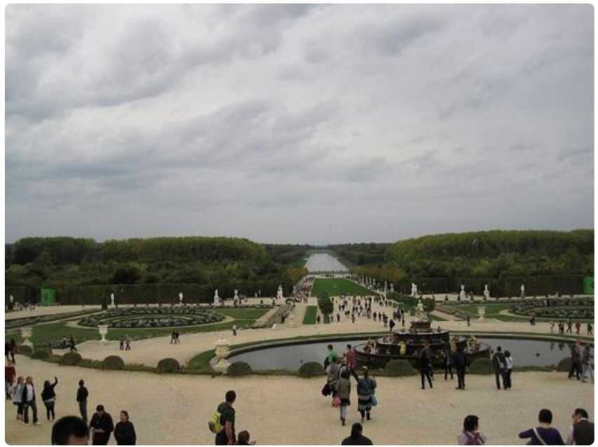
Versaillesin puutarhat ja Grand Canal.