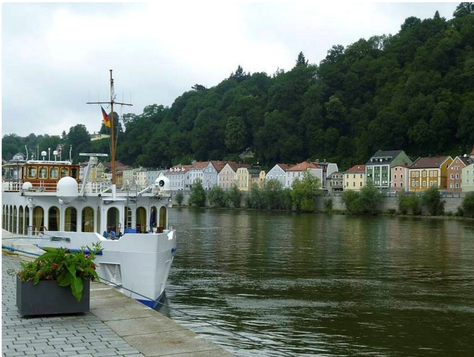
Regensburgin satamassa River Cloud II -laiva odottaa matkustajiaan.