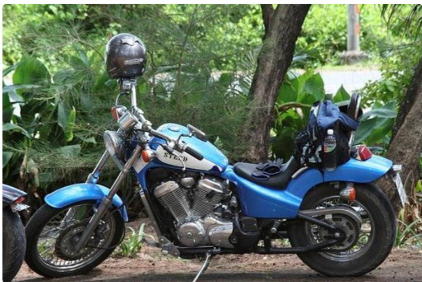
Thaimaassa tyypillinen pyörämalli.