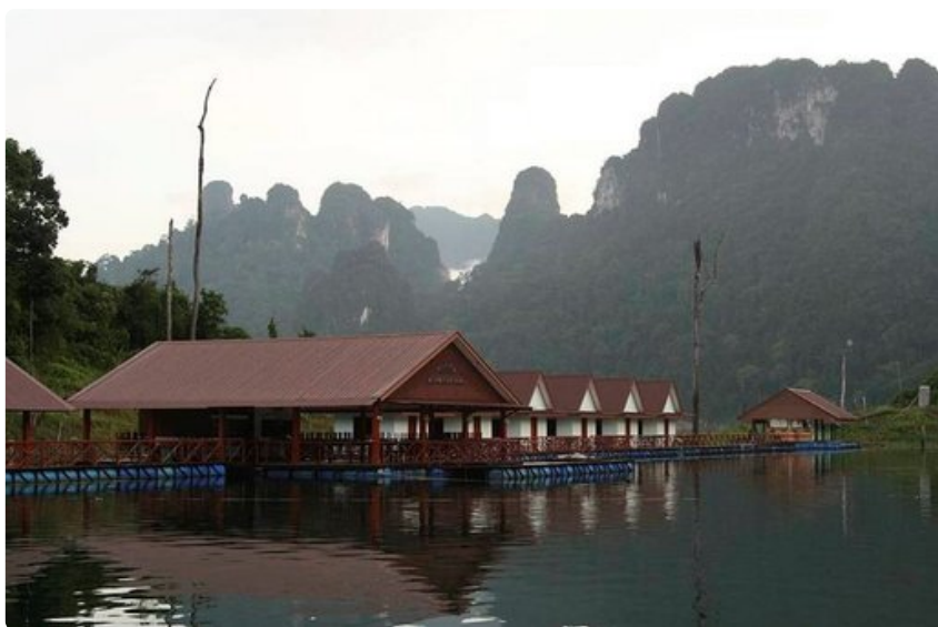
Idyllisiä maisemia pyöräreitin varrelta löytyi paljon.