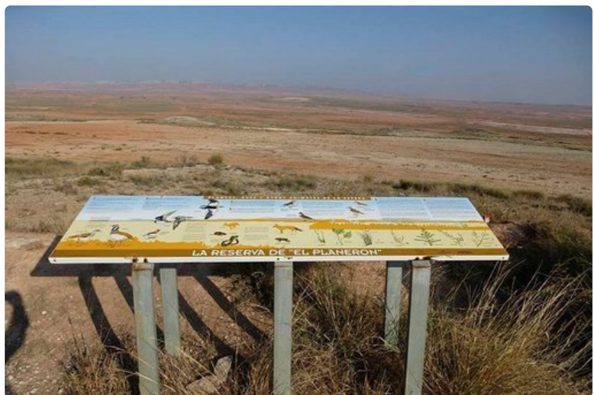
Belchiten aro on Euroopan suurimpia. Lintureservatin reunalla on kuvakooste edessä avautuvasta faunasta. Maiseman punertava sävy johtuu maan rautapitoisuudesta.