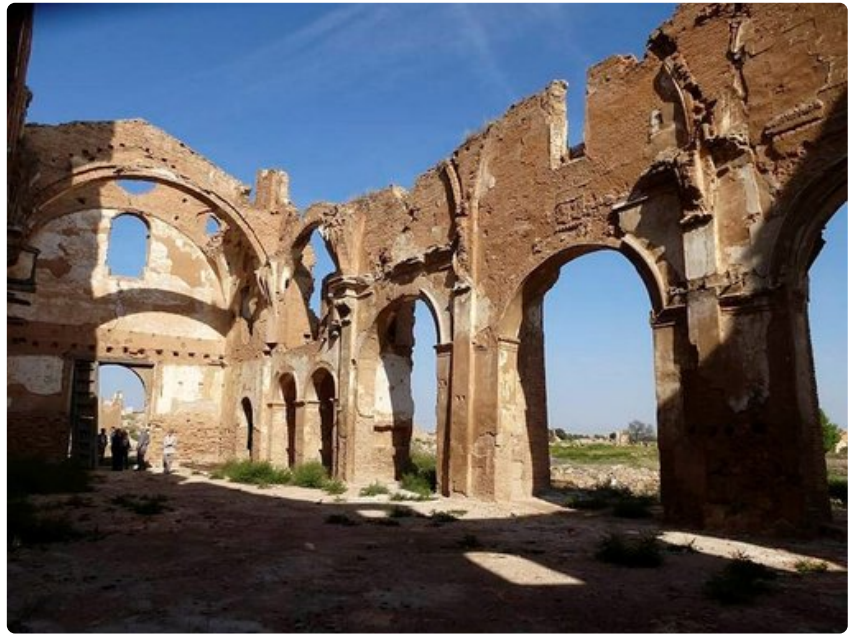
Belchiten katedraalin ranko törröttää mykkänä todistajana sisällissodan mielettömyydestä.

Kesäkuukausina ja joulun tienoilla Fuendetodosissa pidetään viikon kestäviä grafiikkakursseja, cursos de grabado . Sekä valmiit taitelijat että taideopiskelijat perehtyvät grafiikkalehden valmistamiseen aina kaiveruksesta vedostamiseen saakka.