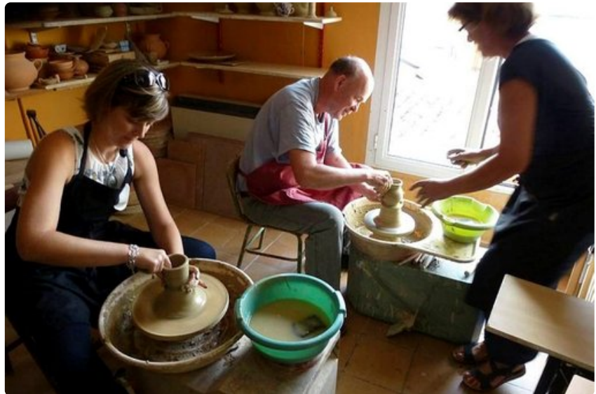
Kuka ties, vaikka matkailija saisi savipotin teosta uuden harrastuksen.