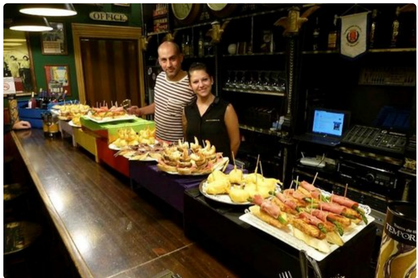
Arkipäivän tapas-kattaus maalaisravintolassa. Que aproveche!