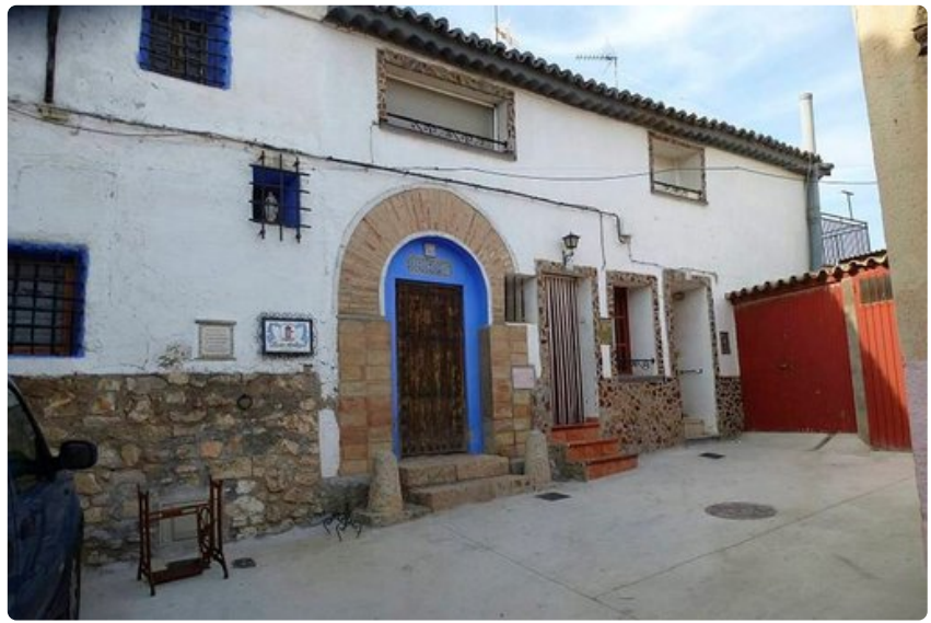
Museona toimiva Francisco de Goyan syntymäkoti.