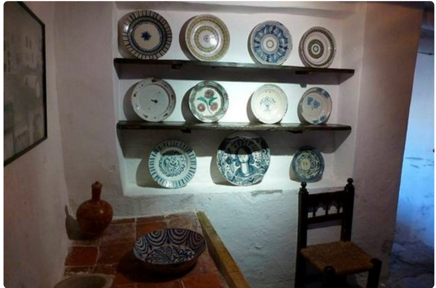
Goyan syntymäkodin sisustus kertoo oman aikansa sisustustyylistä.