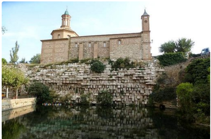
Naisten rakentama, Euroopan vanhin säilynyt pato Muel la Huervassa, on roomalaisvallan ajalta. Sen yläpuolella olevan kirkon kuoressa on Goyan maalauksia.