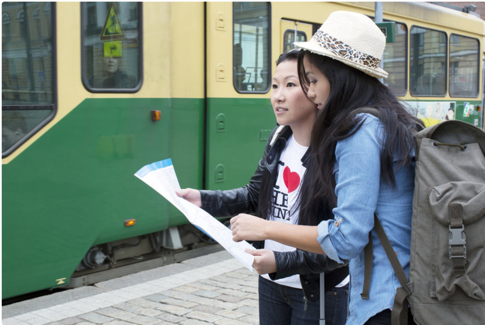
Katutyöt pätkevät ratikkareittejä linjoilla 8, 4, 2 ja 7 kevään ja kesän mittaan.