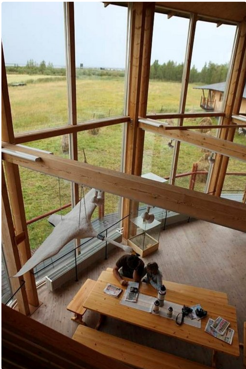
Luontokeskuksen tiloissa on kahvila ja vaihtuvia näyttelyitä.