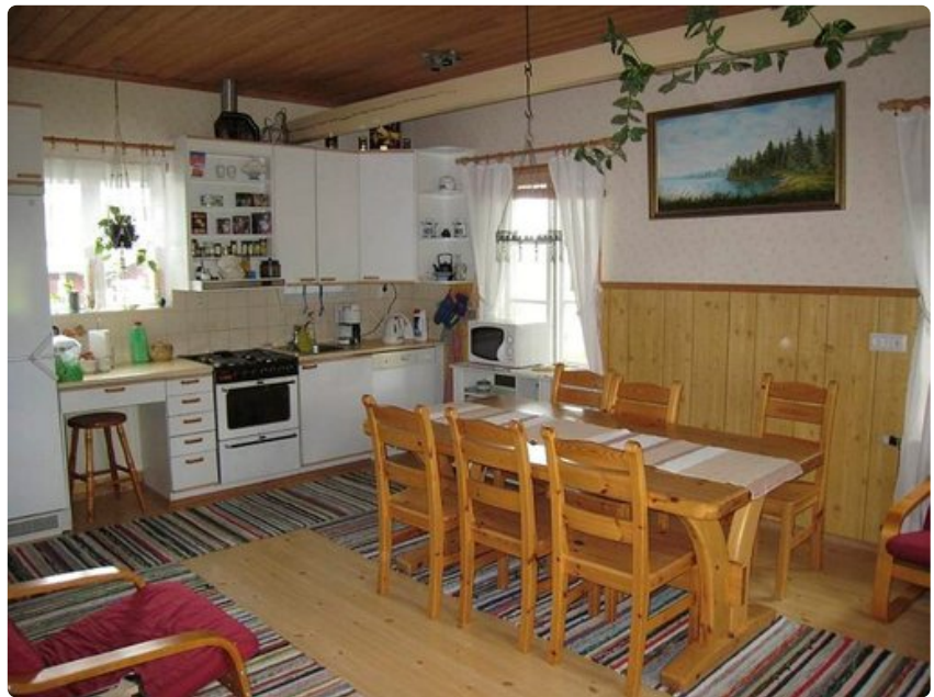
Välimaan vierastuvan keittiö on hyvin varusteltu.