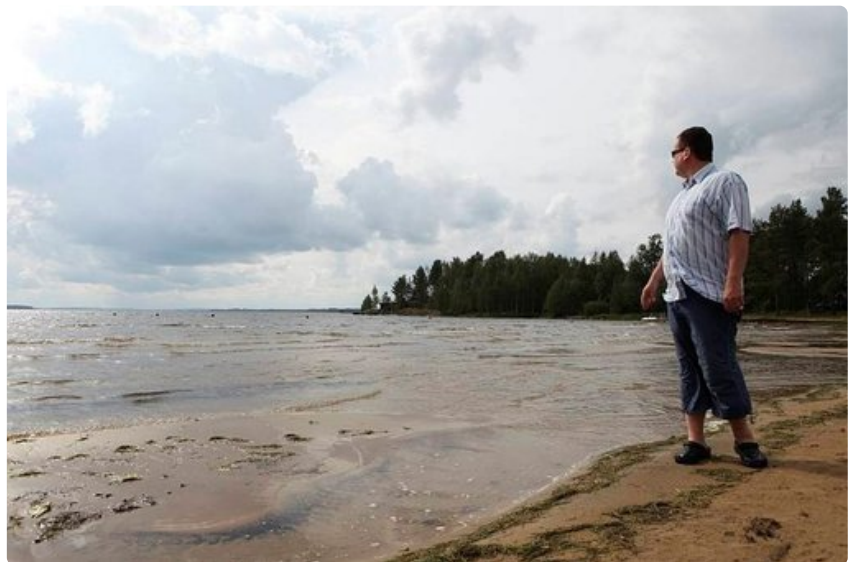
Pyhäjärven Emolahti muistuttaa merenrantaa.