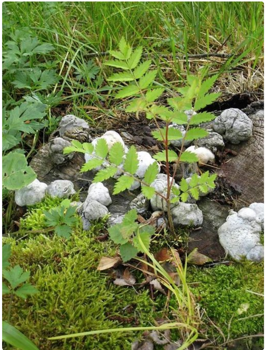
Välilmaan pihalla luonto on lähellä.

Kolmen kilometrin päähän Arolan tilalta on rakennettu karhujen ruokintapaikalle kolme kuvausmajaa, joiden panoraamaikkunoista voidaan turvallisesti seurata karhujen toimia. Autolla pääsee tarvittaessa perille asti. Yhteen kuvausmajoista pääsevät myös liikuntaesteiset ja toisessa voi yöpyä.