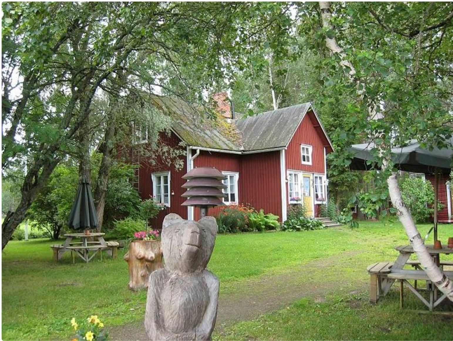
Puinen karuherra vartioi Välimaan vierastalon pihaa.