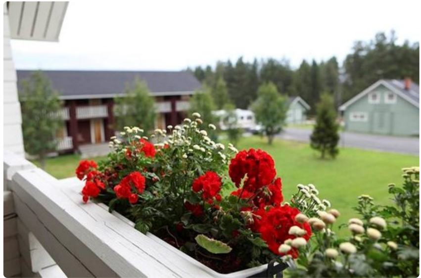
Piilopirtin pihapiirissä on useita majoitusrakennuksia ja rannassa savusauna.