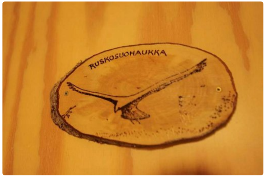
Luontokeskuksen huoneet on nimetty lintujen mukaan.