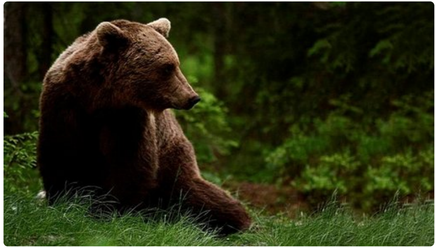
Karhusafarilla nähdään metsien kuningas silmästä silmään.