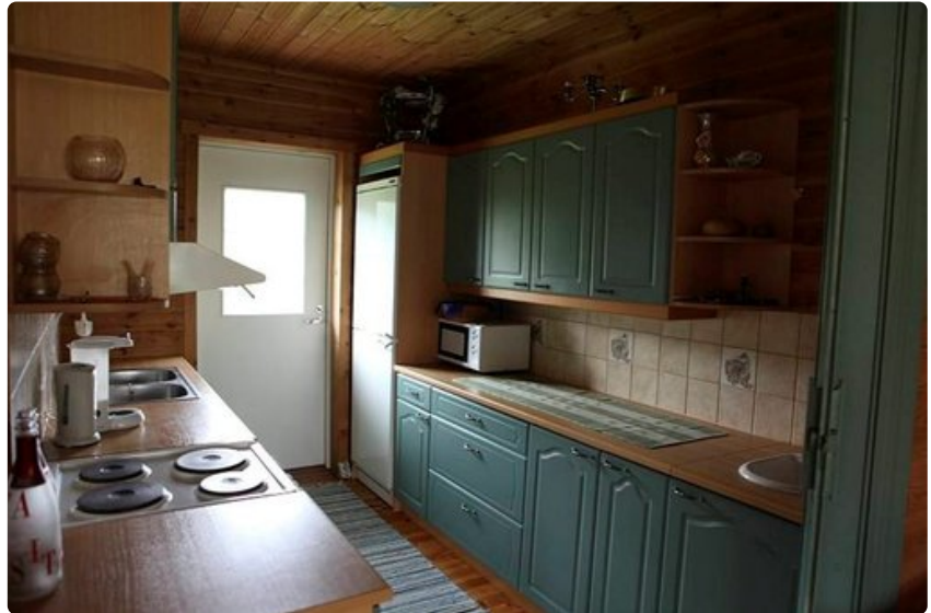
Ison mökin keittiössä mahtuu kokkaamaan päivällisen isollekin ryhmälle.