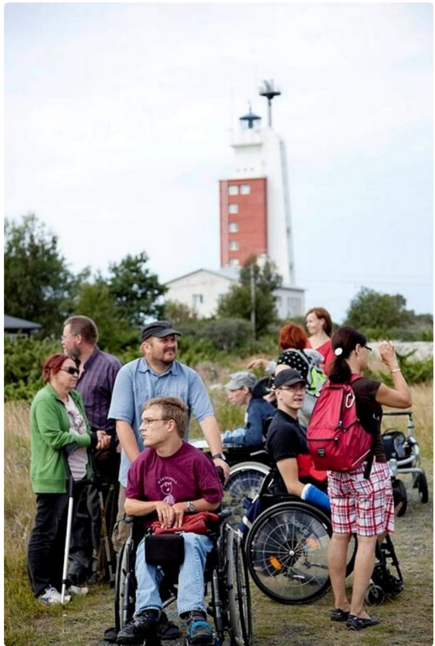
Testiryhmä on juuri astunut maihin Kylmäpihlajassa.