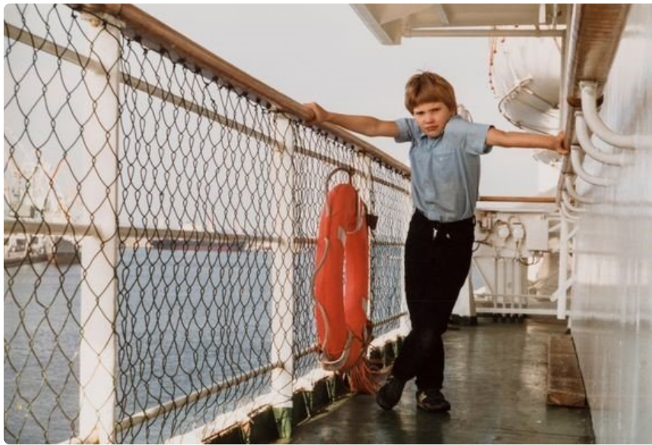
Georg Otsin kannella 1984.

Armas Tallinna –näyttelyssä kurkistetaan helsinkiläisten Tallinnan matkojen värikkäisiin tunnelmiin 1980-luvulta tähän päivään