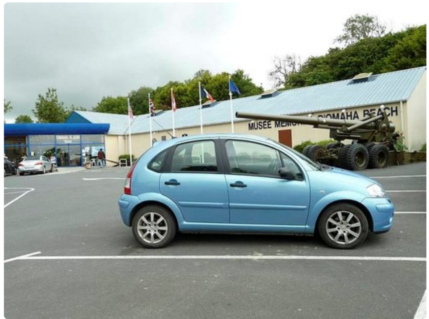
Musée Memorial Omaha Beachistä on vain lyhyt kävelymatka mairinnousurannalle.