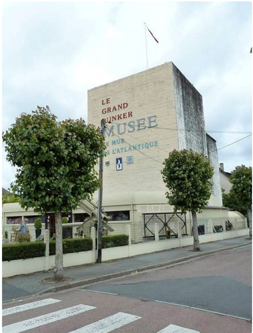
Atlantin vallin museo eli Musée du Mur de l'Atlantique ei sovellu lapsiperheille eikä liikuntarajoitteisille.