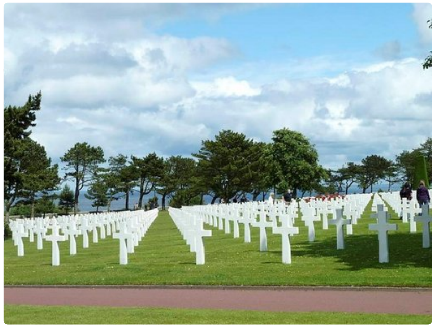
Kauniille paikalle perustetun hautausmaan nurmikentän 9386 valkoista ristiä ovat vaikuttava näky.

Normandiaan ja erityisesti Calvadosin departementtiin houkuttavat toisen maailmansodan muistot, mutta historiakohteiden lisäksi paljon muutakin nähtävää ja koettavaa riittää kaupungeissa ja pirttoreskeissa pikkukylissä. Tarjolla on taidetta ja kulttuuria, eikä lapsiperheitäkään ole unohdettu.