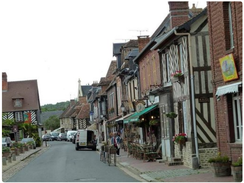
Sodalta säästynyttä Beuvron en Augea keuhetaan yhdeksi Ranskan kauneimmista kylistä.