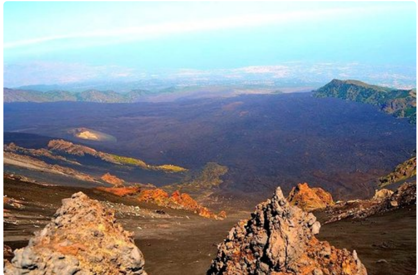
Valle del Bove on Etnan nykyisten huippujen itäpuolella oleva noin 30 000 vuotta sitten muodostunut kraatterilaakso.