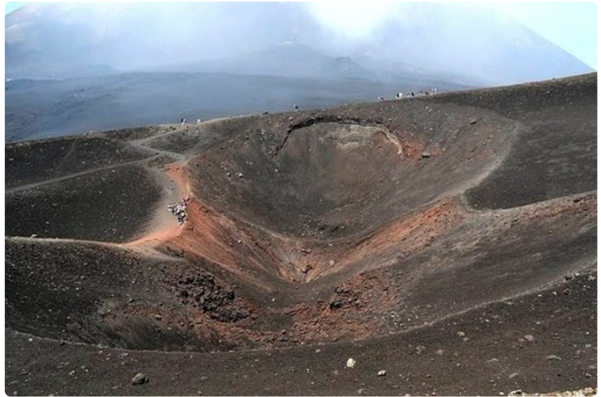
Vuoden 2003 talvella tapahtuneen purkauksen keskuskraatteri. Vulkaanisen kiven korkea rautapitoisuus erottuu selvästi ruosteenruskeana värinä kraatterin seinämissä. Sen keskellä olevasta purkauskanavasta tulee edelleen savua ja tulikuumaa höyryä.