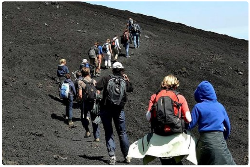
Kiipeäminen alkaa 2500 metrin korkeudesta ylöspäin kohti Etnan huipun jatkuvasti aktiivisia keskuskraattereita.