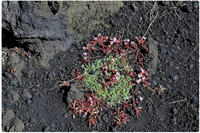
Saponaria sicula kuuluu Etnan kotoperäiseen kasvistoon. Se on sukua Suomessa yleisesti koristekasvina käytettävälle suopayrtille. Kukka on Etnan kansallispuiston tunnus.

Miten pääsee? Suomalaiset matkanjärjestäjät tarjoavat matkoja Sisilian Giardini-Naxoksen ja Taorminaan, joista on noin tunnin ajomatka.