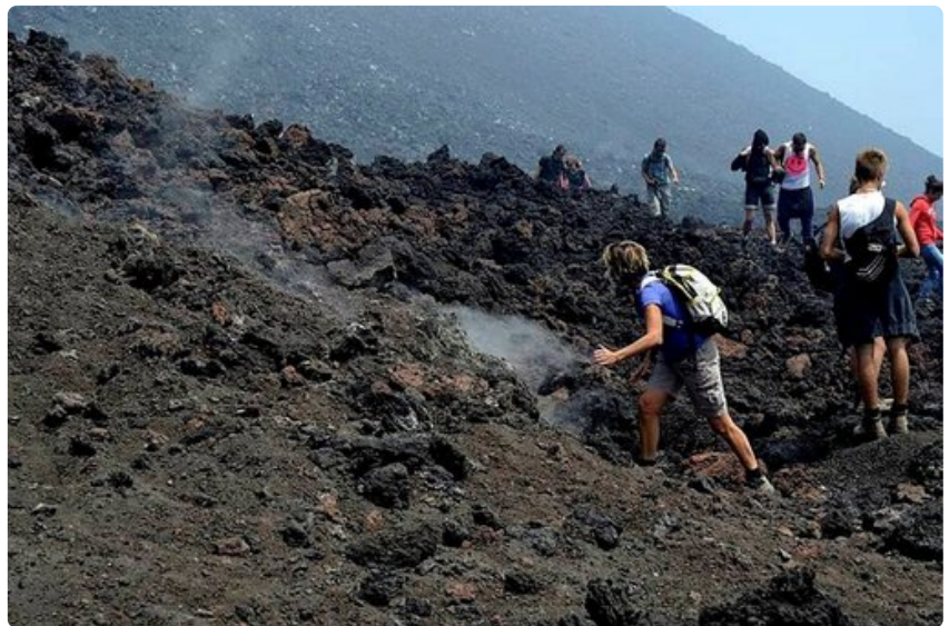
Maasto on paikoitellen vaikeakulkuista ja jähmettyneiden laavavirtojen ylittäminen vaatii tarkkaavaisuutta.