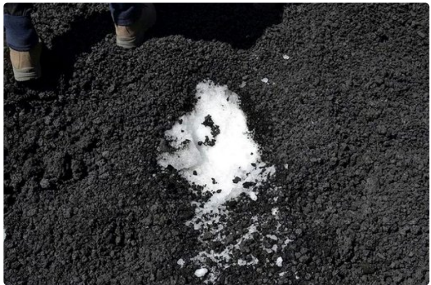
Vuosikertalumi on edelleen hyvin säilynyttä parikymmensenttisen tuhkakerroksen alla.