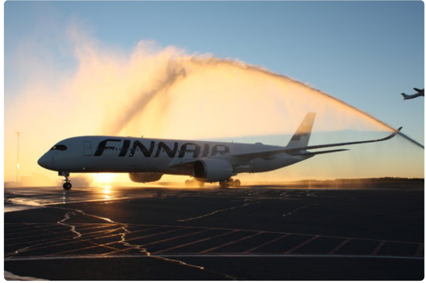
Finnairin kolmastoista Airbus A350 -kone laskeutui Helsingin lentoasemalle Ystävänäpäivänä. Tämä kuva on lokakuulta 2015, jolloin ensimmäinen, kauan odotettu yksilö saapui.