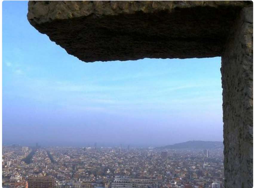
Barcelona on Espanjan toiseksi suurin kaupunki.