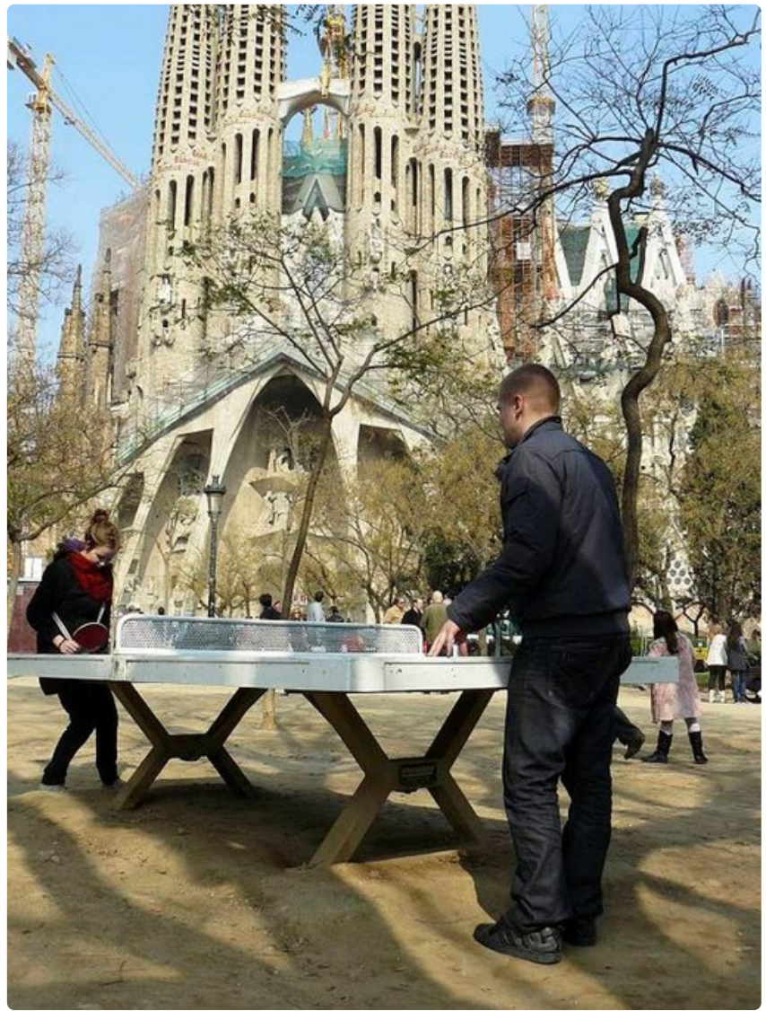
Sagrada Familian edustalla voi ottaa vaikka pingismatsin.