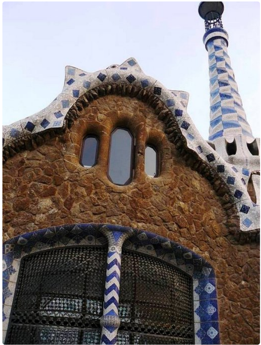
Monet Gaudin luomukset ovat hyvin omaperäisiä.