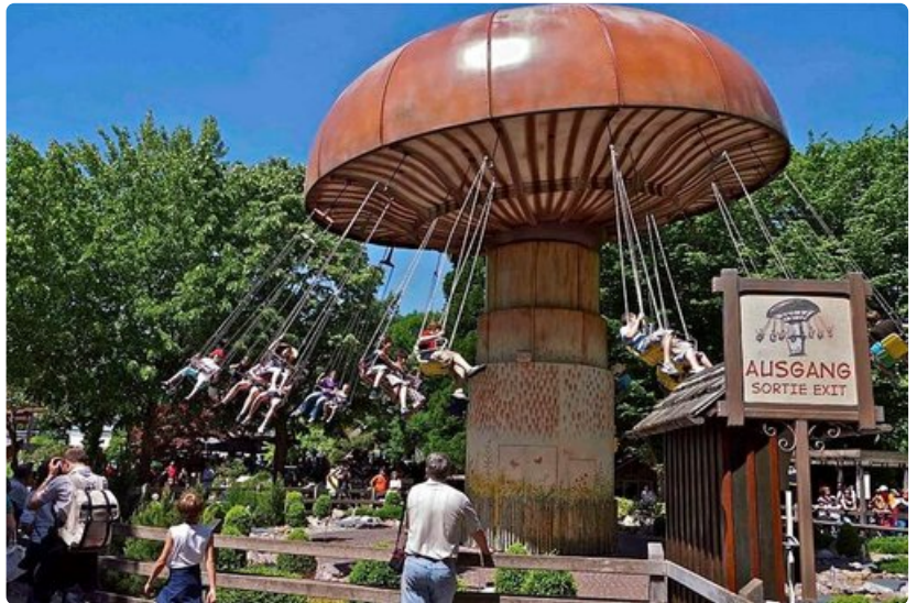
Saksan Europa Park on jättimäinen niin kooltaan kuin kokemuksiltaan.