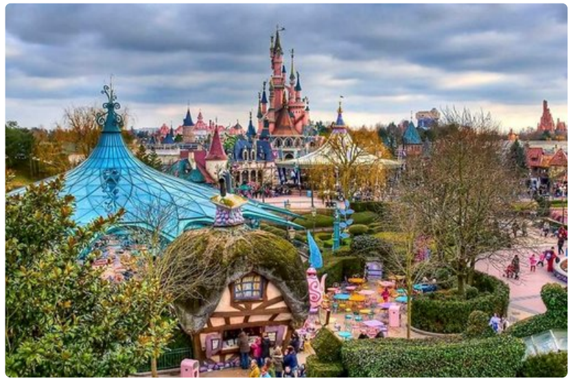
Pariisin Disneyland on Euroopan suosituin huvipuisto.