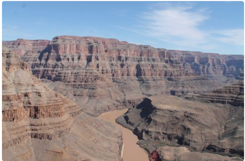
Kanjonin pääsee tutustumaan veneellä, hevosella tai helikopterilla. Myös vaelluskierrokset laaksossa ovat mahdollisia.