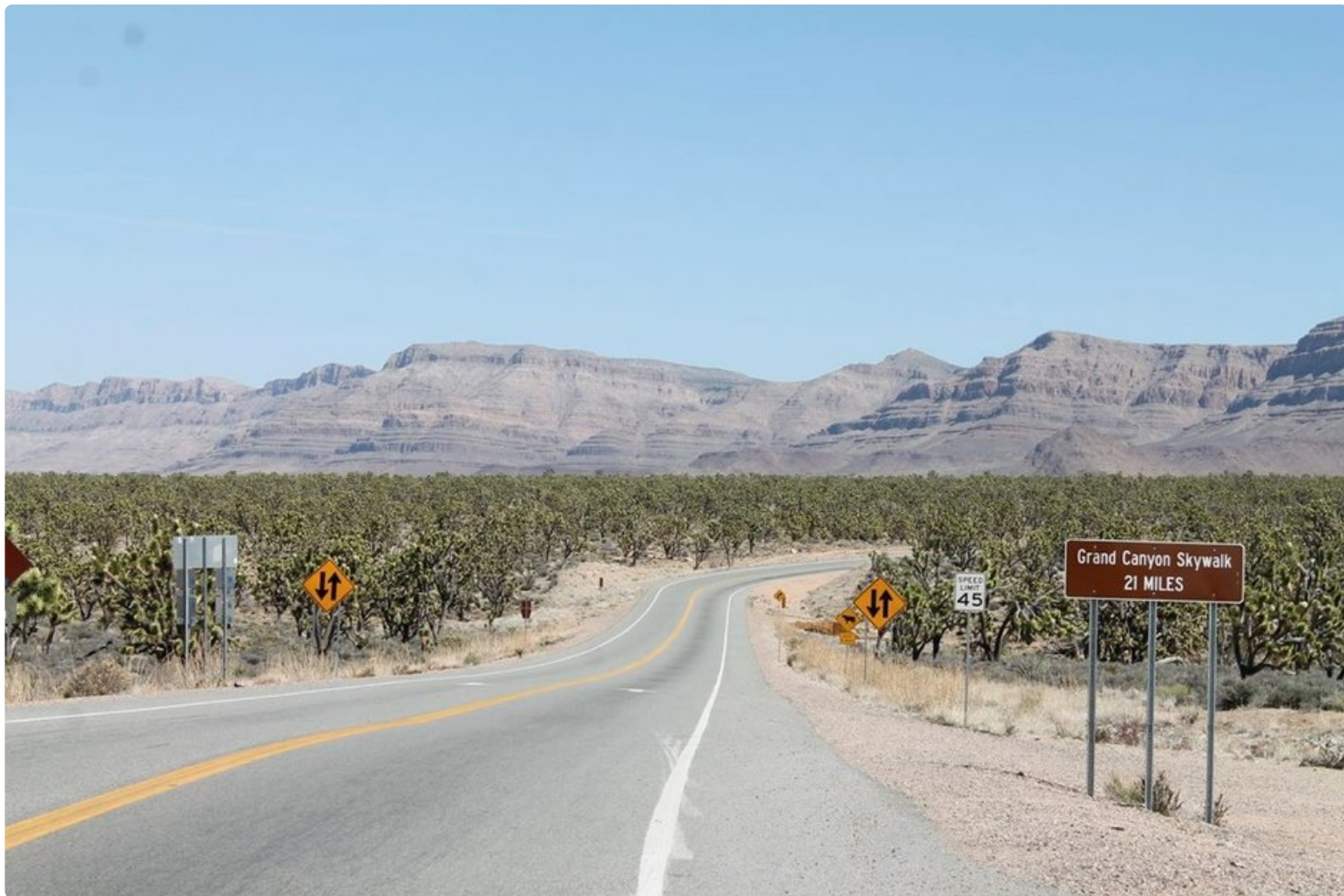
Ajomatka Las Vegasista kanjonille tarjoaa monenlaista maisemaa.