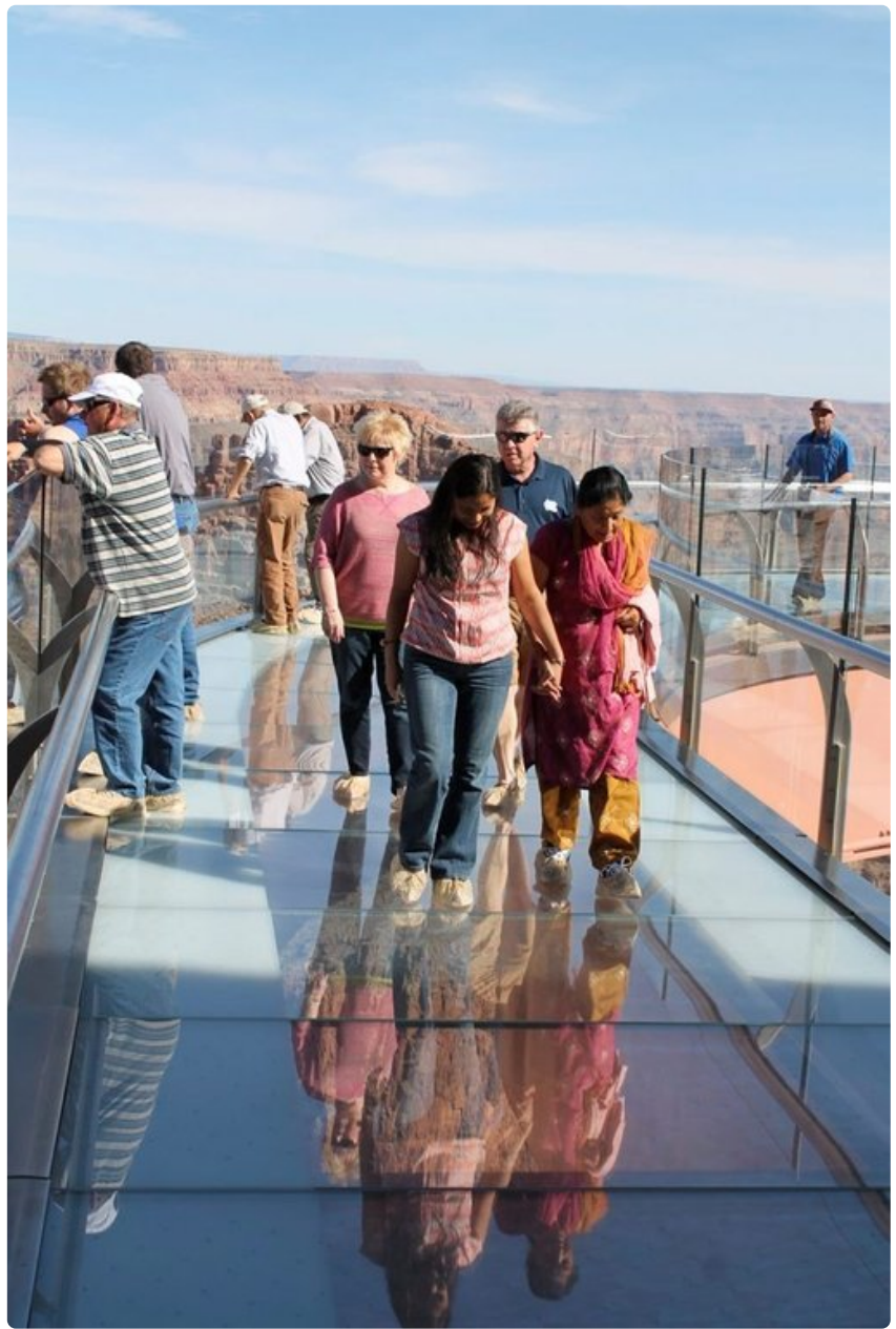
Kävely kanjonin yläpuolella on erikoinen kokemus, jota ei suositella korkeanpaikankammoisille.