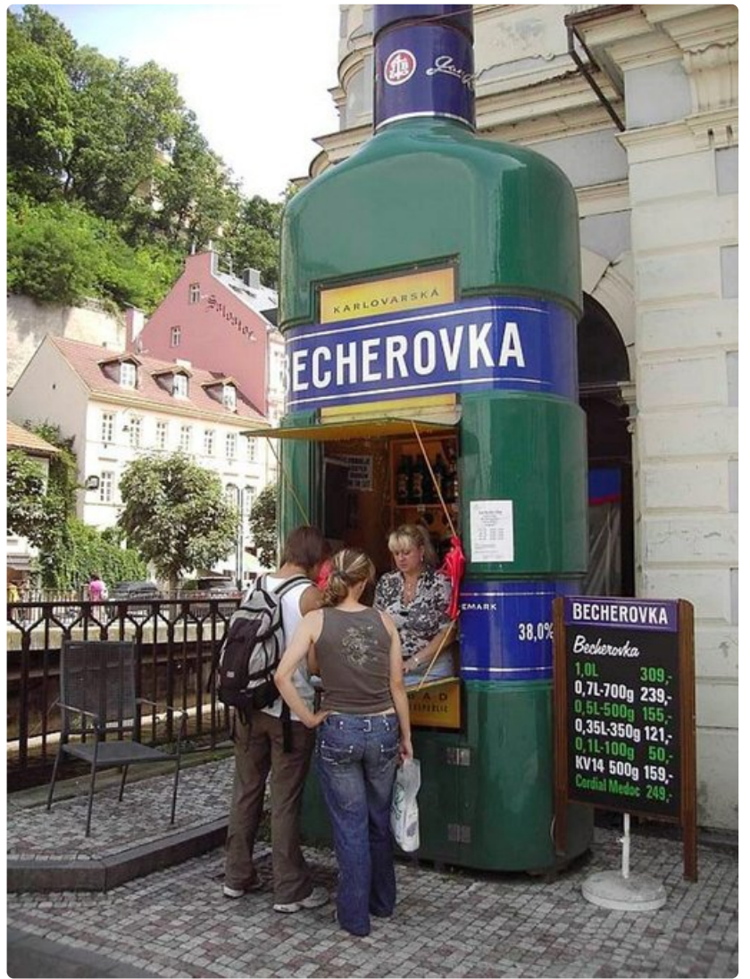
Pullokauppaa pullosta käsin.