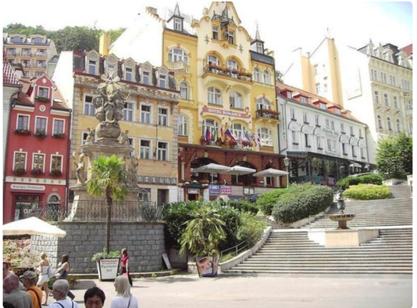
Keskustan vanhat rakennukset ovat nyt joko hotelleja tai ravintoloita.