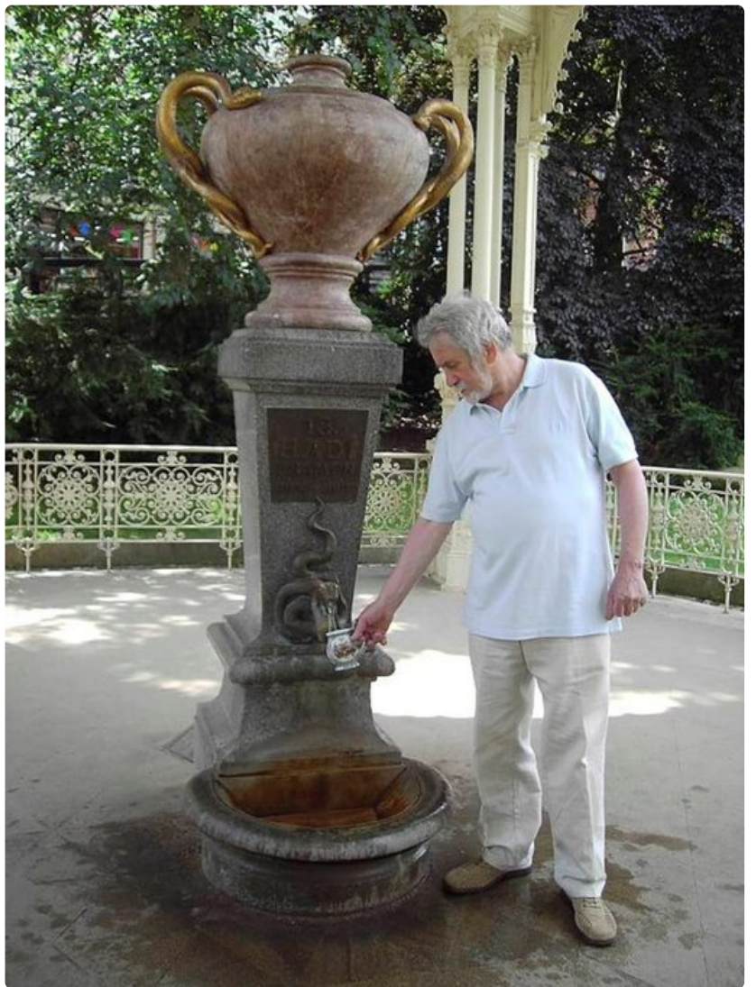
Oikeaoppinen mineraalien maistelu vaatii posliinikupin.