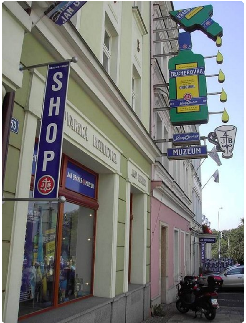
Apteekkari Josef Becherin vatsatippoja on myyty vuodesta 1807.