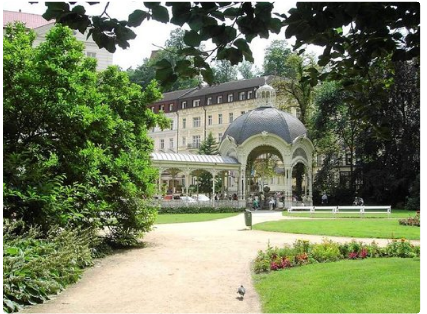
Antonín Dvořákín puistoa reunustaa Puistokolonnadi.