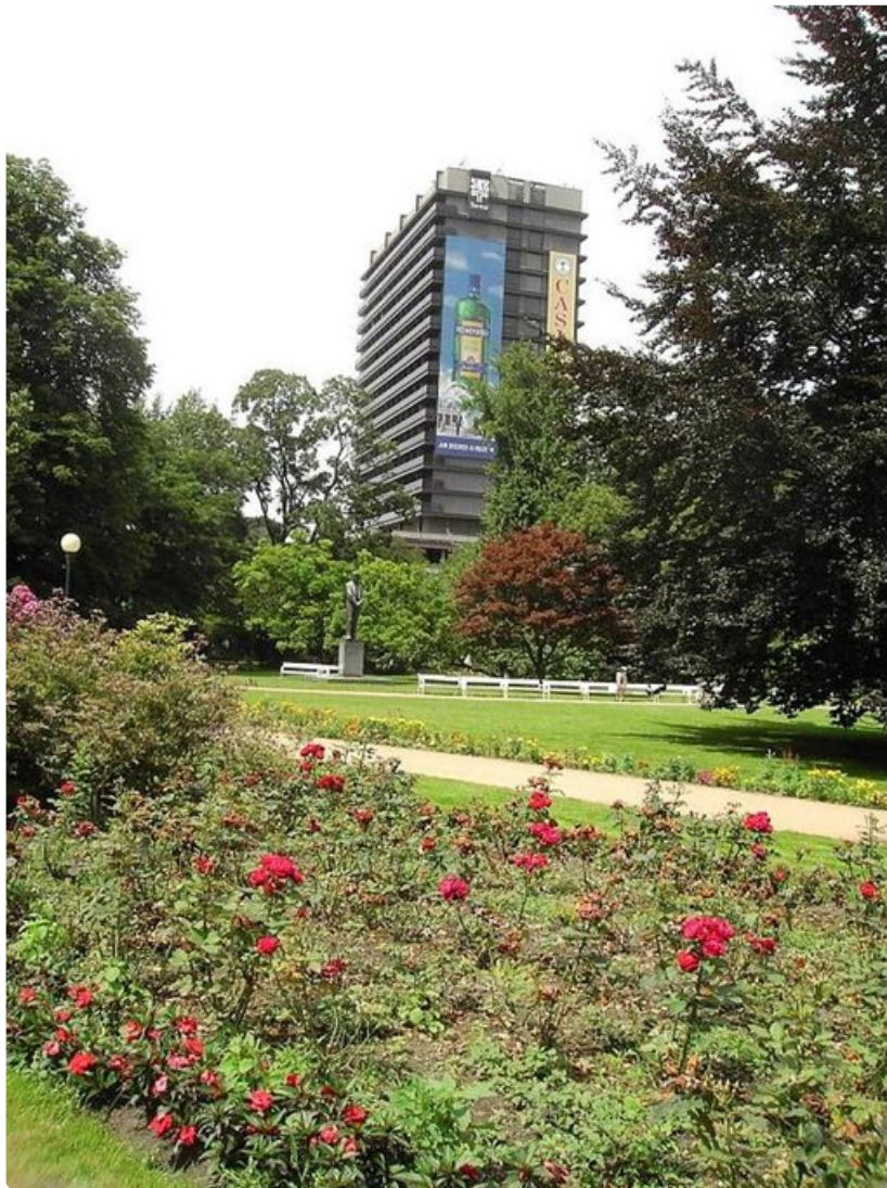
1970-luvulla rakennettu Spa Hotel Thermal edustaa hieman uudempaa arkkitehtuuria.