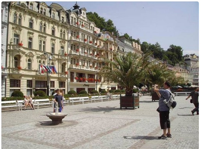
arlovy Vary houkuttelee matkailijoita ympäri maailmaa, mutta ennen kaikkea Venäjältä.