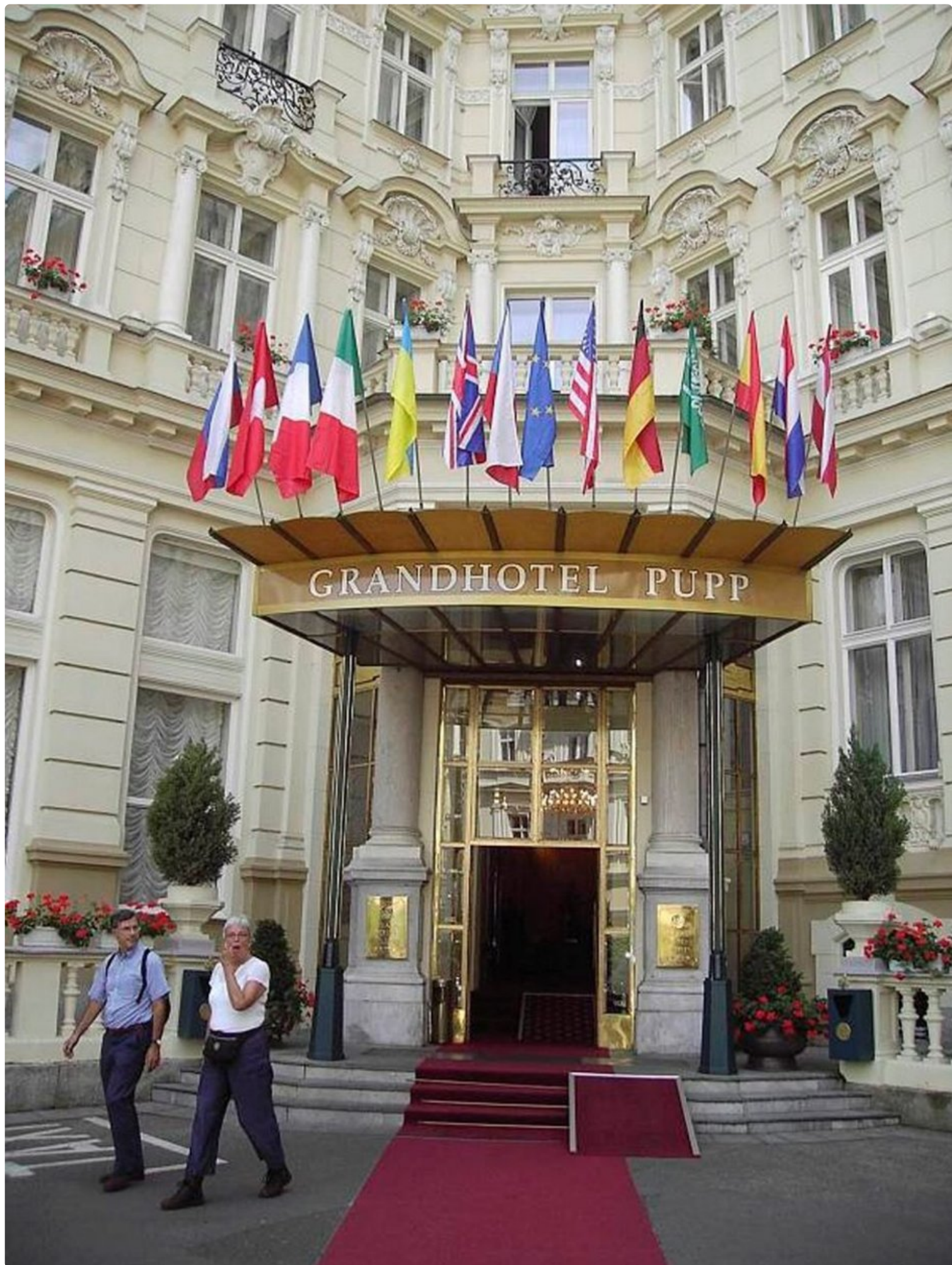
Grandhotel Puppin sisäänkäynti.

Kuumien lähteiden ja kylpylöiden Karlovy Vary