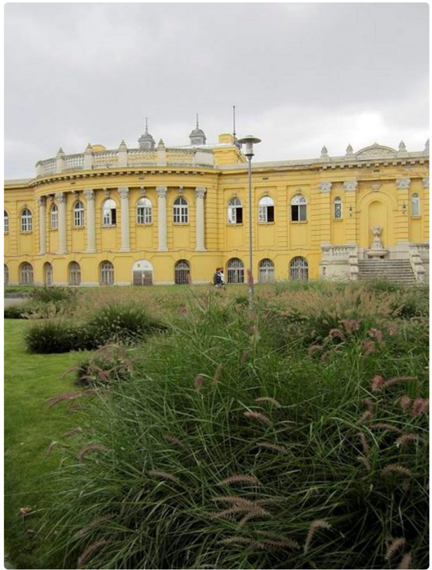
Széchenyin kylpylän päärakennus.