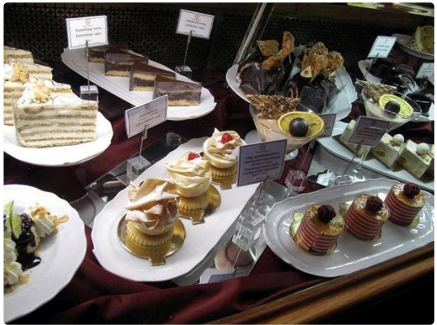
Gellértin kahvilan suussa sulavat herkut kutsuvat maistelemaan.