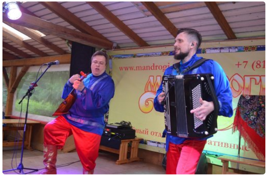
Moskovan Aika esiintyy vauhdikkaasti Mandrogin turisticaarella.