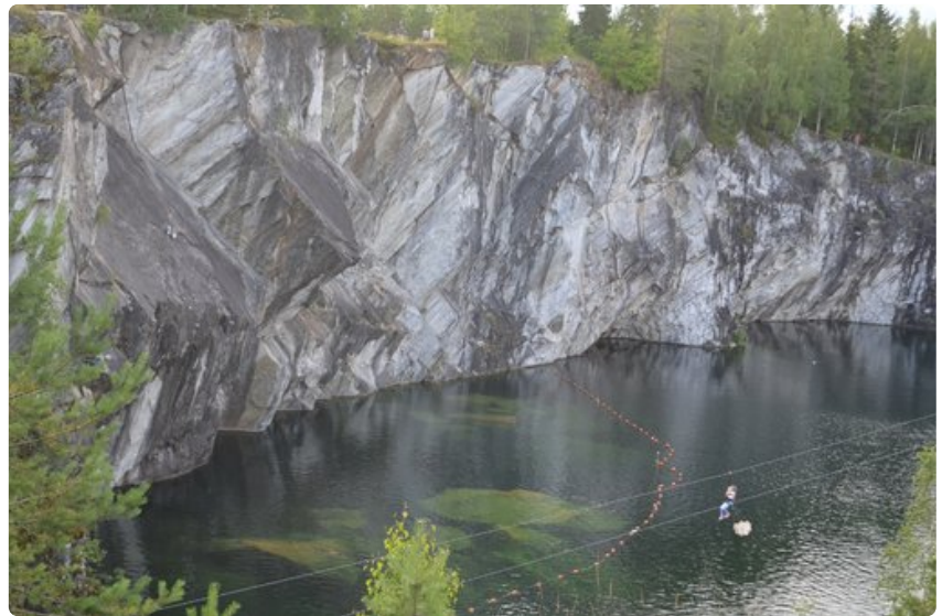
Ruskealan marmorilouhos Sortavalassa on suosittu turistikohde.