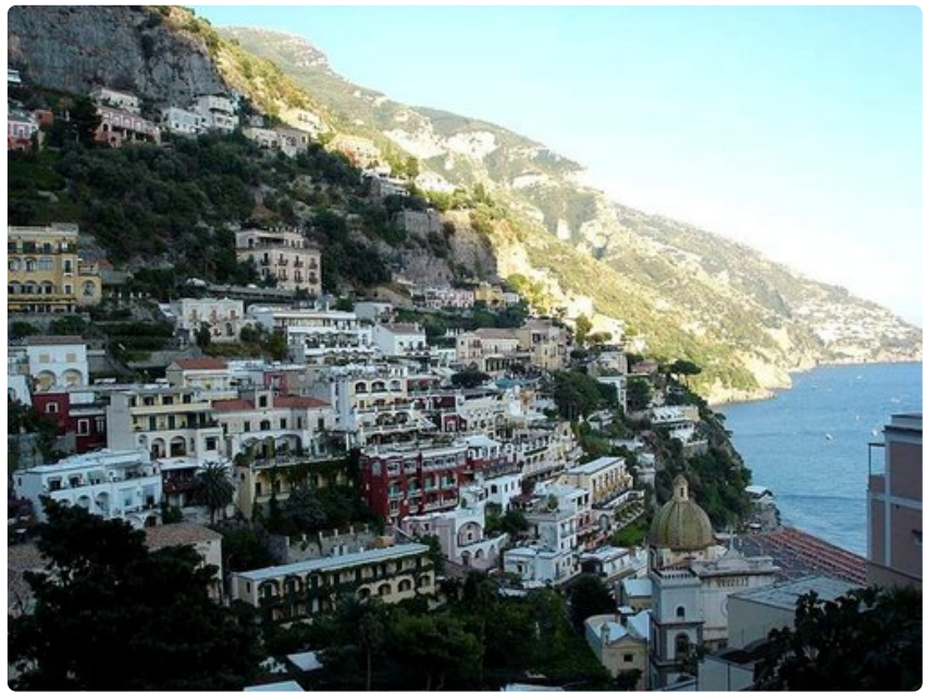
Auringon laskiessa kukkuloiden taakse Positanon kylä jää varjoon.

Aurinko laskee kukkuloiden taakse, taivas syvenee tummansiniseksi ja yhtäkkiä huomaamme täysikuun. Se roikkuu taivaalla suurempana kuin olen koskaan nähnyt ja luo hopeisen sillan ulieliaan meren ylle. Istumme laiturin reunalla lasten kanssa, katselemme rannalla ylösalaisin makaavia kalastajaveneitä - sinisiä, valkoisia ja punaisia - sekä Positanon rinteissä sadoittain tuikkivia valoja. Yritän opettaa lapsia laulamaan Hopeista kuuta. Harmi kyllä sanat ovat hukassa sekä suomeksi että italiaksi. Guarda la lu-u-una... tyydymme hoilaamaan. Uudestaan ja uudestaan.