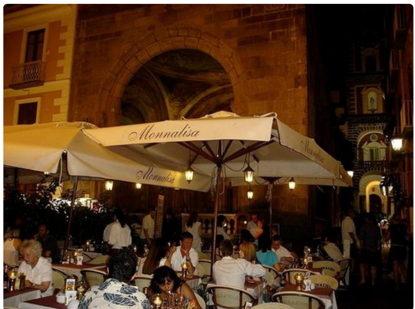
Syyskuussa ostoskujat vilisevät elämää, lokakuussa sesonki on ohi.