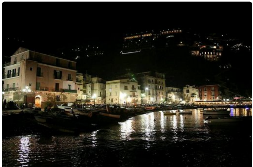
Iltaelämää Marina Granden varrella.

Kuvat kimaltelevasta Välimerestä ja sitruunapuulehdoista sekä lasten rakkaus spaghetti bologneseen saivat meidät aikuiset hetyämään. Onneksi. Napoli ja Vesuviuksen tulivuori jäivät +35 -asteen paahteessa näkemättä, mutta me löysimme omat huvit. Nelivuotiaamme melkein oppi uimaan, tyttäremme ihastui friteerattuihin mustekaloihin ja neljäsluokkalainen esikoispoikamme pääsi verryttelemään niin englannin kuin italian kielen taitojaan. Äiti ja isä saivat maistaa la dolce vitaa, ihanaa elämää.