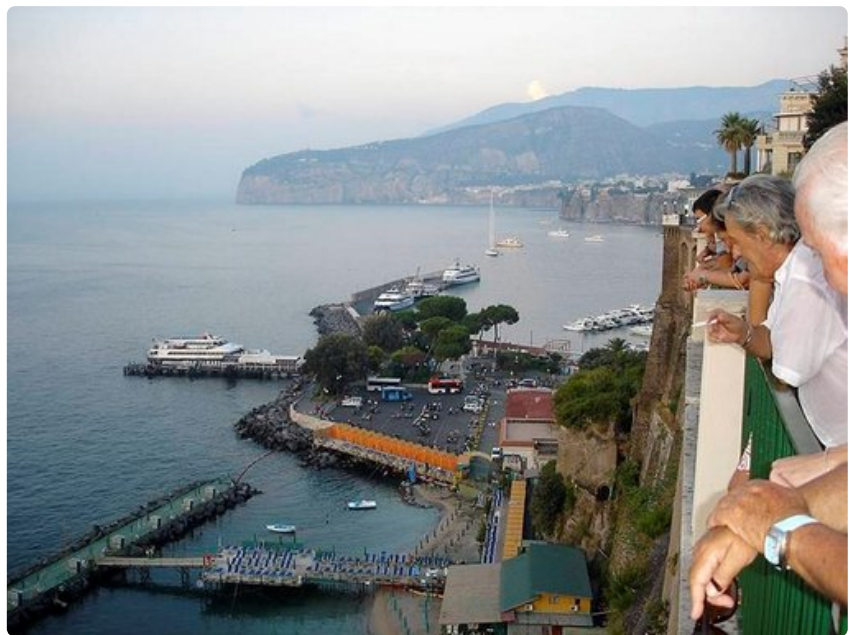
Näköalapaikalta San Francescon kirkon lähellä voi ihmetellä pieniä uimarantoja ja yhteysalusliikennettä.