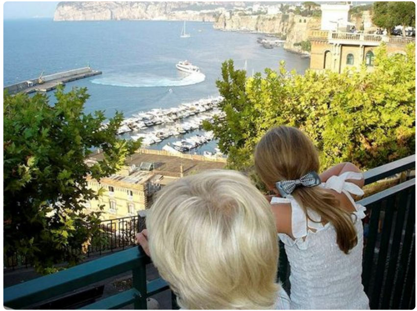
Yhteysalus kaartaa kohti Capria. Helpoimmin lauttasatamaan pääsee paikallisbussilla Piazza Tasso -aukiolta.