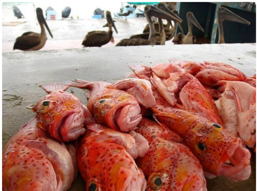
Kalaa tahtoisivat syödä muutkin kuin matkailijat.