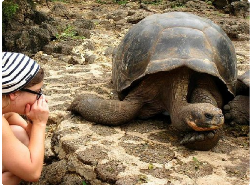
Jättiläiskilpikonna ei jaksa jutustella suomeksi.