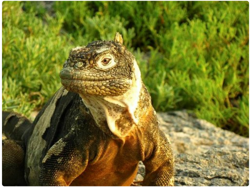
Leguaani ei piittaa matkailijoista.

o Ympäristö on asetettu matkailun edelle.