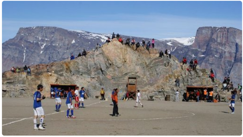
Grönlannissa ei ole paljon tasaisia paikkoja, joten kaikki tila käytetään hyväksi.