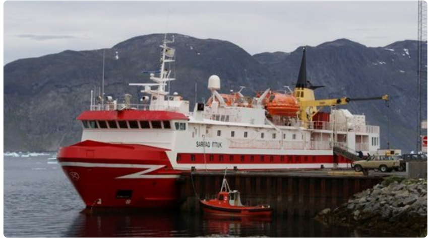
Liikkuminen Grönlannissa tapahtuu lentäen tai laivateitse.