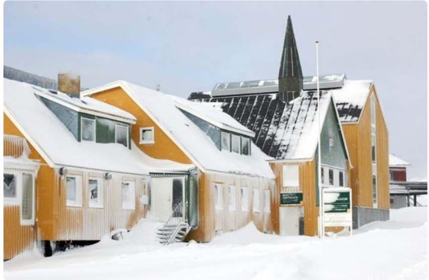
Mikään rakennus ei ole Grönlannissa suuri. Ohessa maan taidegalleria.