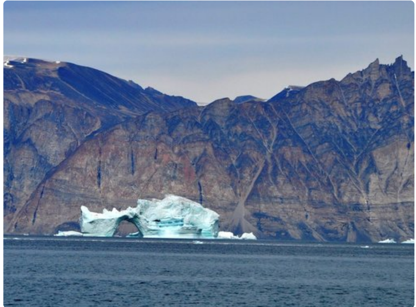
Raaka maisema on Grönlannin valttikortti.