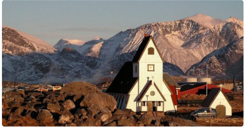
Syvällä Grönlannissa voi törmätä äärettömän kauniisiin kohteisiin.