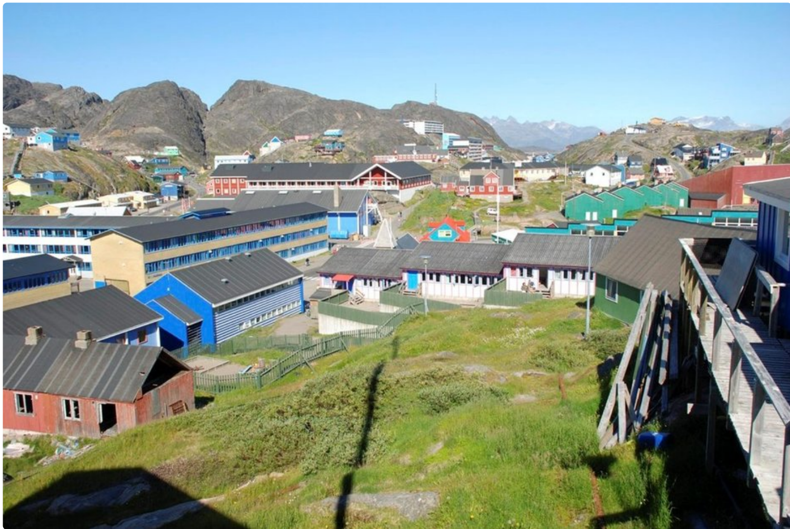
Pääkaupunki Nuuk on värikkäiden talojen kylä.