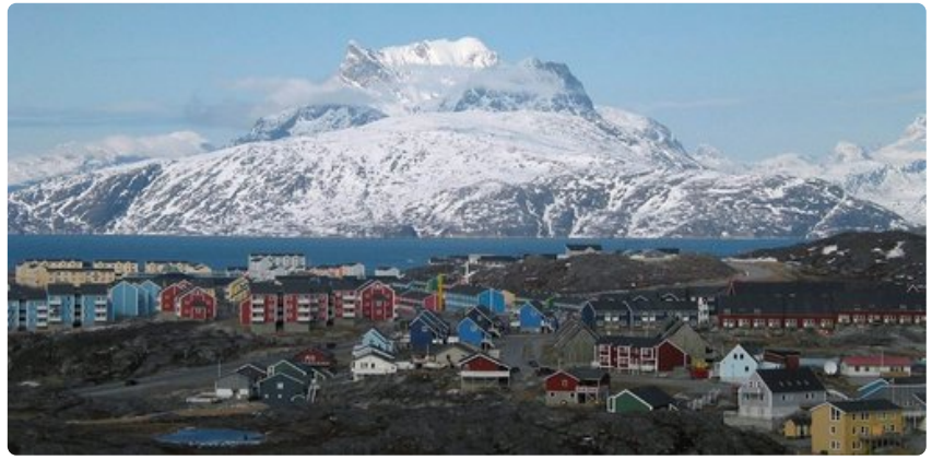
Nuukin takana kohoavat jylhät vuoret.