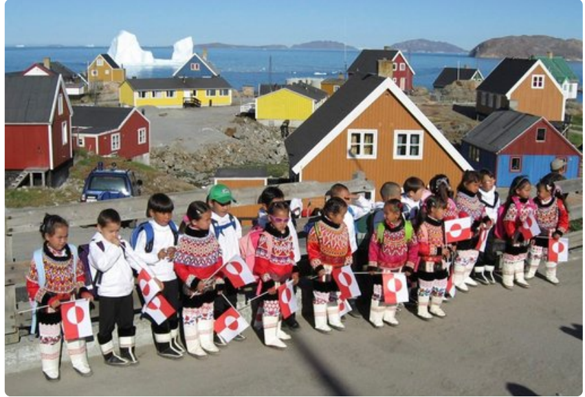
Inuiittikulttuuri on vahvasti edelleen läsnä esimerkiksi lasten vaatetuksessa.