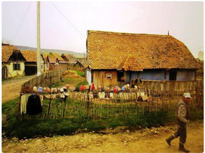
Romaniasumus ja käsitöiden myyntyä.

Tuhat kilometriä Tonavaa erottaa Romanian naapureistaan, Bulgariasta ja Serbiasta. Joki muodostaa Mustanmeren rannikolla suiston, jonne muuttolinnut lentävät pakoon pohjoisen talvea. Vapaan liikkumisoikeuden EU:n sisällä takaavaa Schengen-sopimusta ei vielä sovelleta Romaniaan eikä naapurimaahan Bulgariaan. Saksa ja Ranska eivät olleet viime vuoden lopulla valmiit hyväksymään Unionin yksimielisyyttä vaativaa päätöstä. Eurovaluutan tavoiteajankohdaksi Romania on asettanut vuoden 2014, taloustilanteesta johtuen euron käyttöönoton oletetaan siirtyvän hamaan tulevaisuuteen. Nykyinen valuutta, uusi Romanian lei otettiin käyttöön vuonna 2005. Rahaa voi hyvin vaihtaa Henri Coandan lentokentän rahanvaihtopisteissä. Alkukevään päivänä pääkaupungin kansainvälinen kenttä on hiljainen. Kentältä on keskustaan matkaa 18 kilometriä ja jos ei ole ruuhkia, se vie parikymmentä minuuttia.