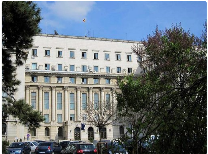
Kommunistisen puolueen Keskuskomitean rakennuksen parvekkeelta Ceausescu aloitti viimeisen puheensa ja josta hän pakeni helikopterilla joulun alla vuonna 1989.