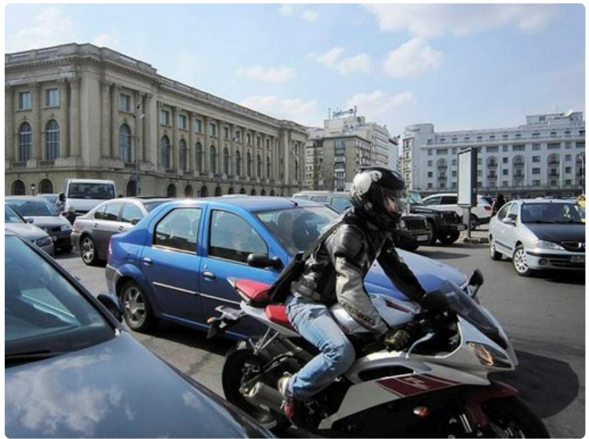
Bukarestin liikenne on kaottista. Kävellessä on mielenkiintoista seurata kaupunkilaisten taitoa selviytyä ruuhkassa.