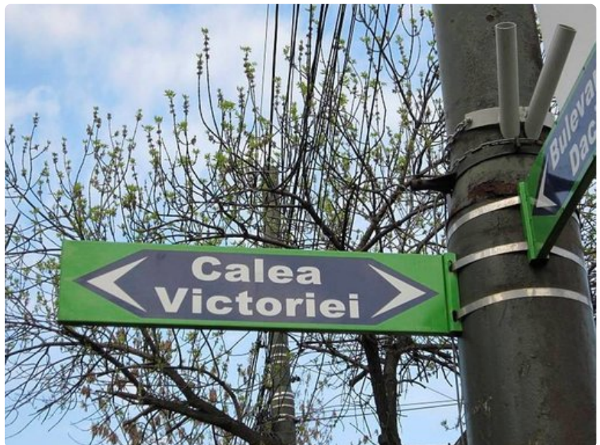
Bukarestin vanhin ja kuuluisin katu.