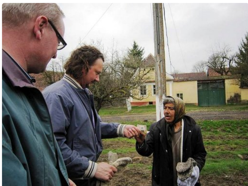
Romaninainen myy villasukkia.