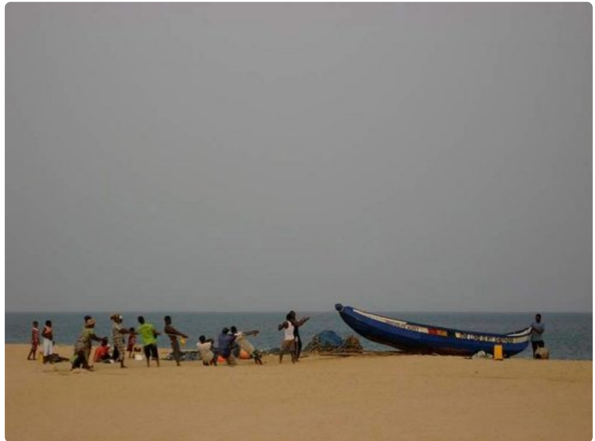
Kalastajat kiskovat venettä Ketan palmuista riisutulla rannalla.