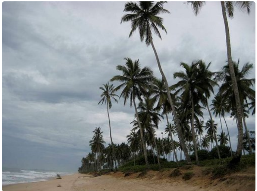
Cape Coastin yliopiston rannalla tarkenee pilvisenäkin päivänä.