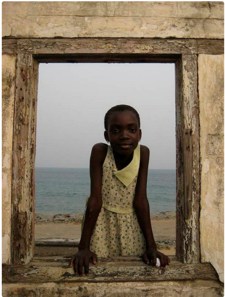
Fort Prinzenstein'n ikkunat raamittavat näkymää Guineanlahdelle.

Togon puolella matkaa voi jatkaa jalan, sillä Lomé'n keskusta sijaitsee kahden kilometrin päässä rajalta. Hôtel de Galionissa voi yöpyä, illallistaa ja kuunnella livemusiikkia perjantai-iltaisina. Tunnelmallisen majapaikan alakerrassa on baari, jossa voi törmätä muun muassa tummansiniseen puvuntakkiin ja valkoiisiin suoriin housuihin sonnustautuneeseen ruotsalaisherraan, oikeustieteiden tohtoriin, joka nauttii elämästään Togossa.