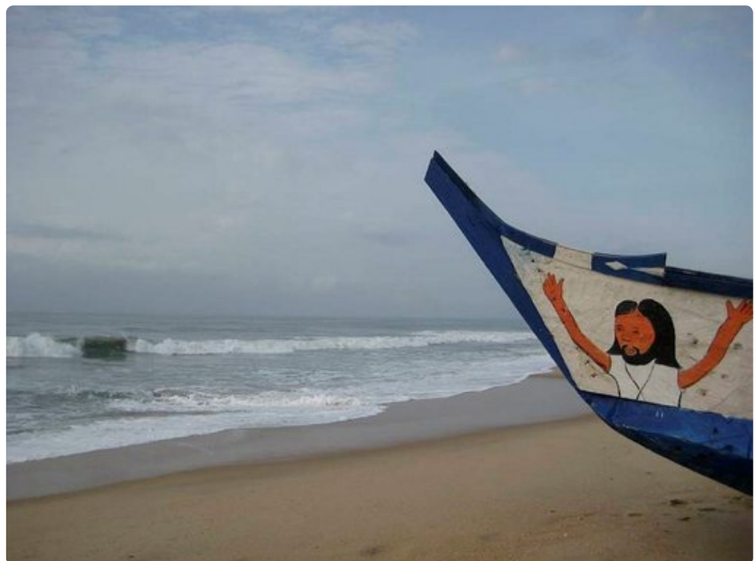
Ghanalaiset rakastavat kahta j:tä, nimittäin jalkapalloa ja Jeesusta. Molempiin voi törmätä rannalla.