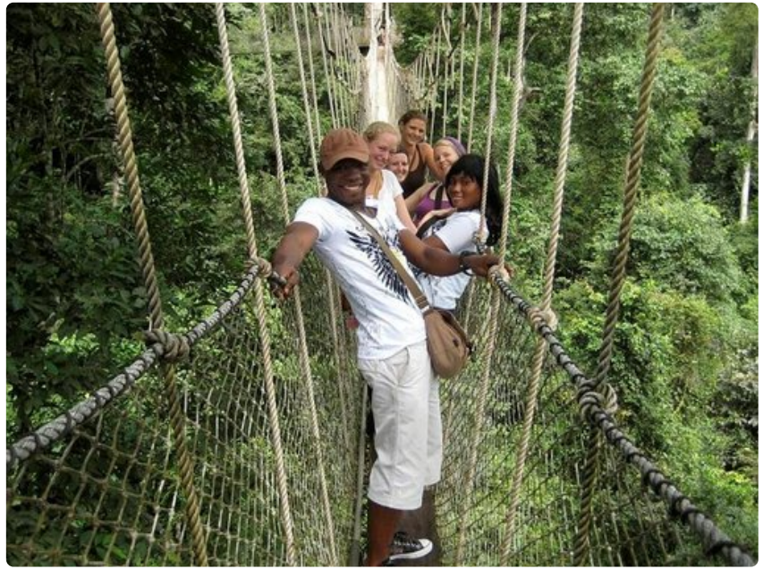
Ystävykset lankulla Kakumin korkeuksissa.

Toinen poika sulloi sätkivät kalat paitansa helmaan ja työnsi ylipursuavat kalat alushousuihinsa.