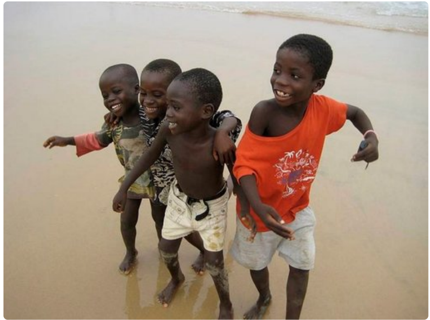
Lapset tanssivat azzontoa hiekkarannalla.

Matkustaminen sujuu kätevimmin, joskaan ei kovin joutuisasti, trotrolla . Näillä minibusseilla ei ole tarkkoja aikatauluja tai pysäkkejä, vaan ne lähtevät sitten kuin ovat täynnä. Kyytiin voi hypätä myös suoraan kadulta, kuljettajan apuri ja rahastaja kertoo kyllä mihin auto on matkalla.