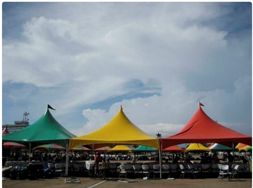
Mustan tähden aukiota kansoittavat Ghanan lipun värejä kantavat teltat.