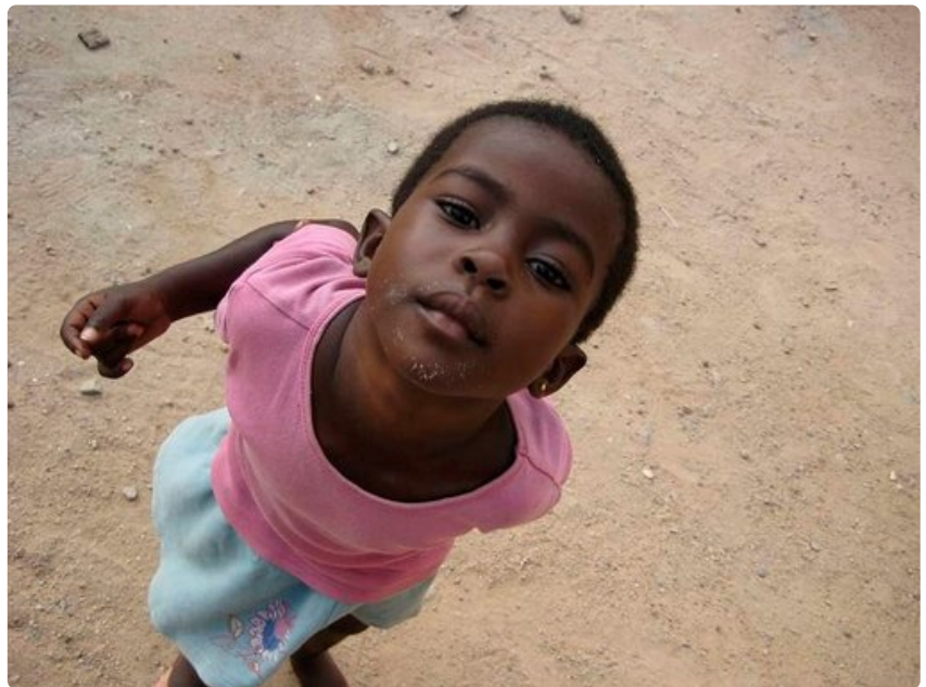
Kohtaaminen Cape Coastin kadulla.