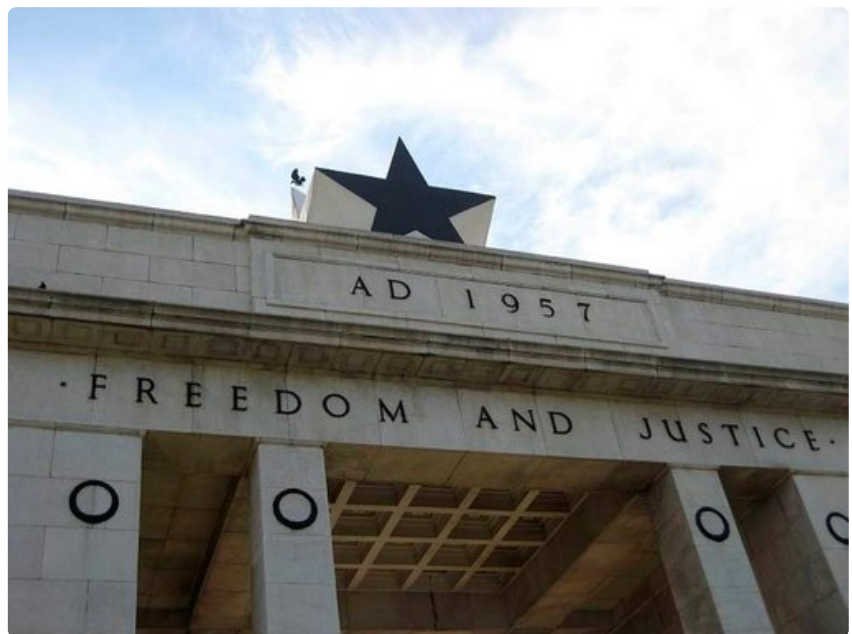
Vapaus ja oikeudenmukaisuus on Ghanan motto.