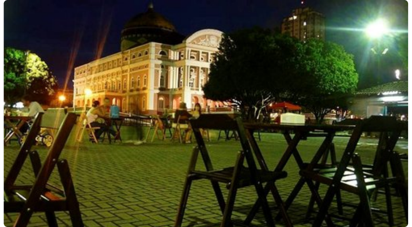
Raikas hedelmäjuoma maistuu Manauksen teatterin vieressä olevalla terassilla.