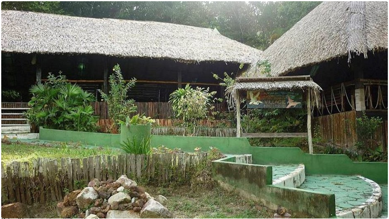
Majapaikkamme vastaanotto ja ruokasali.