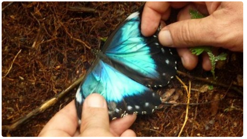
Viidakkokävelyllä nähdyllä perhosella oli loistavan kauniit siivet.