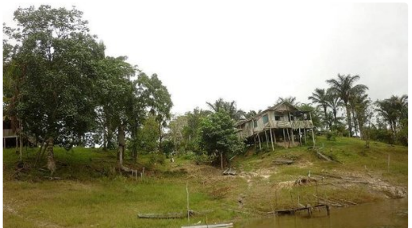
Paikallisten asukkaiden rakentama asumus kyhöttää joen rannassa.