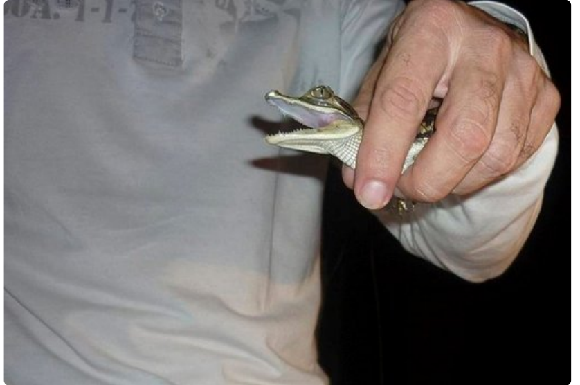
Opas esittelee kaimaanin poikasta.