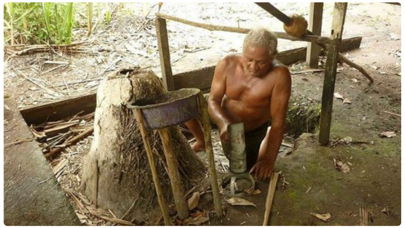
Mies valmisti kumipuusta kondomeja.

Kuinka varaus hoidetaan: Varauksen voi tehdä ainakin kolmella tapaa: 1) Etukäteen internetissä, 2) Vertaamalla tarjouksia lentokentällä 3) Menemällä kaupunkiin ja tekemällä päätös sieltä käsin. Nopein, helpoin ja mahdollisesti myös halvin tapa on tehdä varaus etukäteen internetissä. Lentokentällä kauppa tekevät oppaat eivät todennäköisesti ole kaikista ammattitaitoisimpia, vaan parhaat matkanjärjestäjät hoitavat myyntinsä internetissä tai toimistosta käsin.