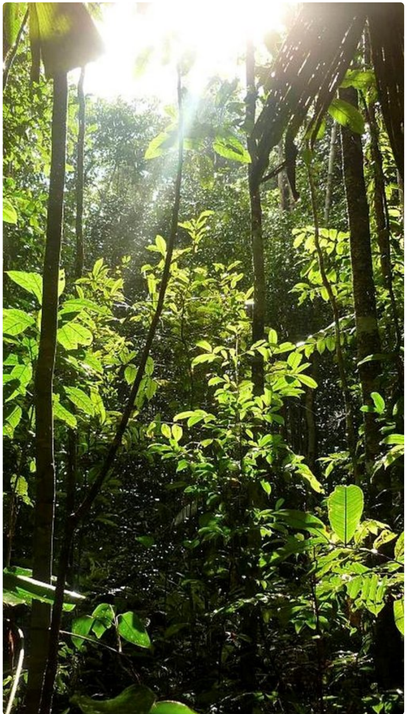
Viidakkokävelyllämme aurinko paistoi ja vettä satoi.