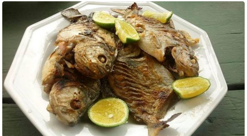
Itse pyydystetyt pirajit maistuivat herkullisilta.