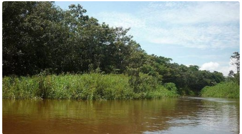
Venereitti muuttui paikoin melko kapeaksi.