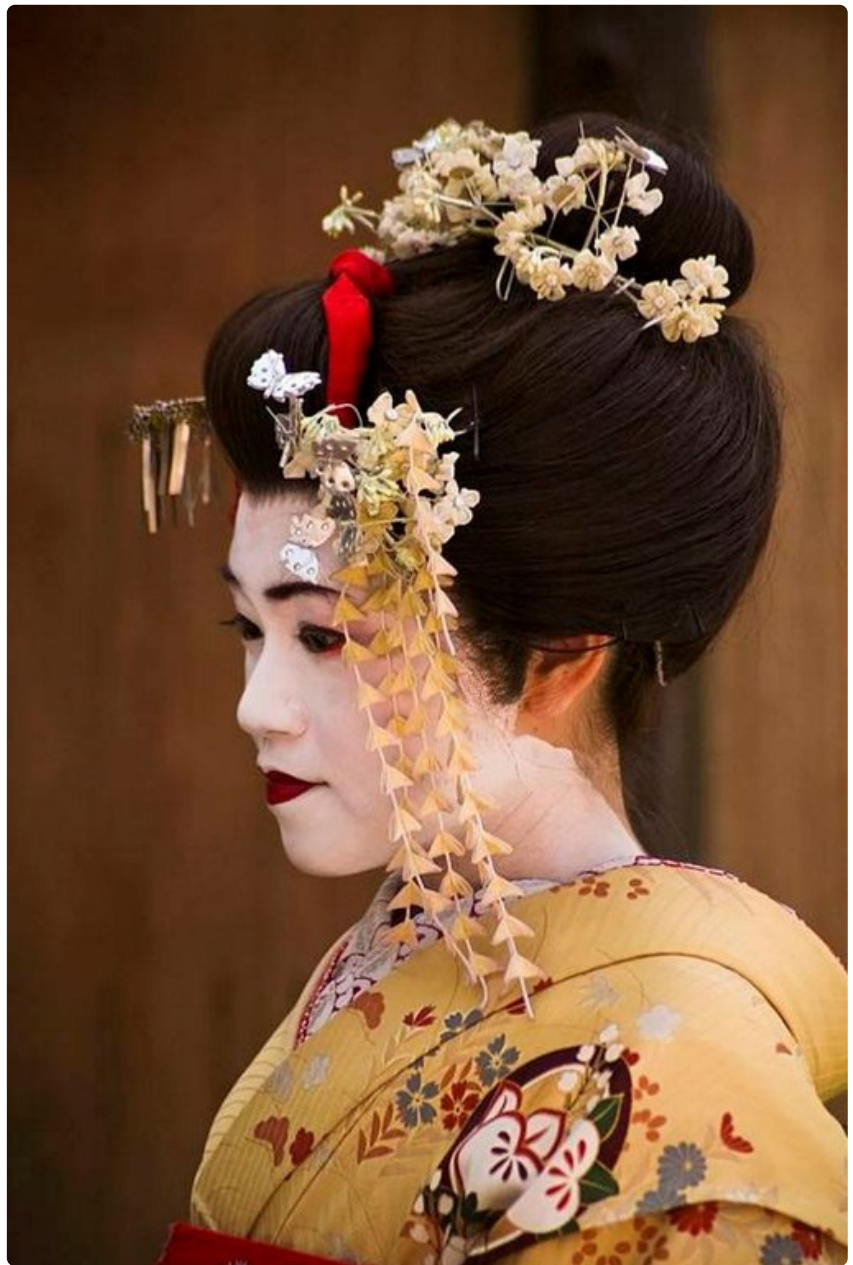
Kulttuurillisissa tilanteissa pienet detaljit kertovat oman tarinansa.