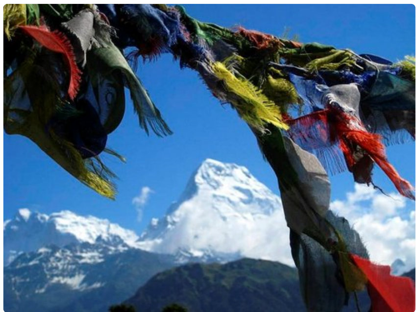
Tarinan kerronta on tärkeä osa matkakuvaamista.