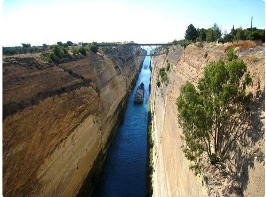
Korintin kanavaa liikennöivät nykyisin turistilaivat ja paikalliset veneet. Isot alukset joutuvat kiertämään niemimaan, sillä kanava on vain 27 metriä leveä.

Terveyttä edistävää mineraalivettä voi maistella puistossa sijaitsevasta kaivosta Loutrakissa.