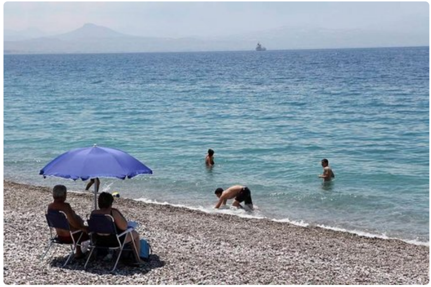
Loutrakin pikkukiviranta on kaksi kilometriä pitkä. Uimakengät helpottavat rantaelämää.