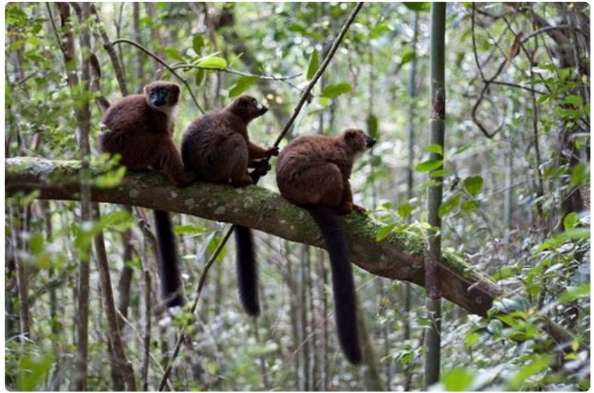
Punavatsalemurit päästävät ihmiset todella lähelle. Kaikki lemurilajit ovat uhanalaisia, koska madagaskarilaiset ovat syöneet niitä huonon ravintotilanteen vuoksi.

Yksi asia mikä matkaoppaista ei selviä, on paikallisten ystävällisyys ja luotettavuus. Köyhissä maissa liikkuminen saattaa tuntua turvattomalta, mutta ei Madagaskarilla. Paikalliset ovat tyytyväisiä siihen vähään mitä heillä on. Hymyyn vastataan poikkeuksetta hymyllä ja "salama"-tervehdykseen vähintään naurulla. Kaupanteko on helppoa ja tinkiminen kannattaa, eikä matkailijoilta yritetä hujata isoja rahasummia. Madagaskarilainen mora mora eli "hitaasti, hitaasti" -elämänasenne tarttuu ja on ihailtavaa.