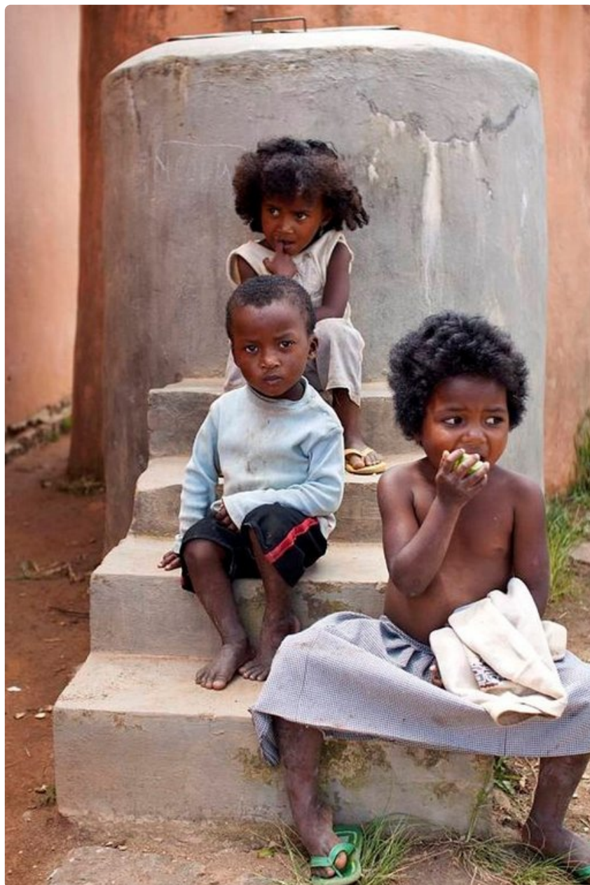
Monet madagaskarilaiset lapset joutuvat lopettamaan koulun kesken, koska heidän vanhemmillaan ei ole varaa antaa rahaa kouluruokaan.