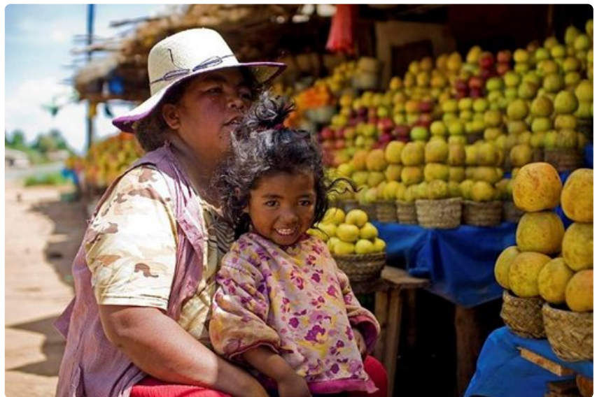
Bussimatkoilla matkailija voi nauttia kauniisti järjestetyistä hedelmäkojuista sekä silmillään että makuistillaan.