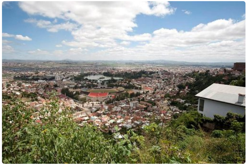
Pääministerin palatsin kukkulalta aukeavat näymät Antananarivon sokkeloisille kaduille.