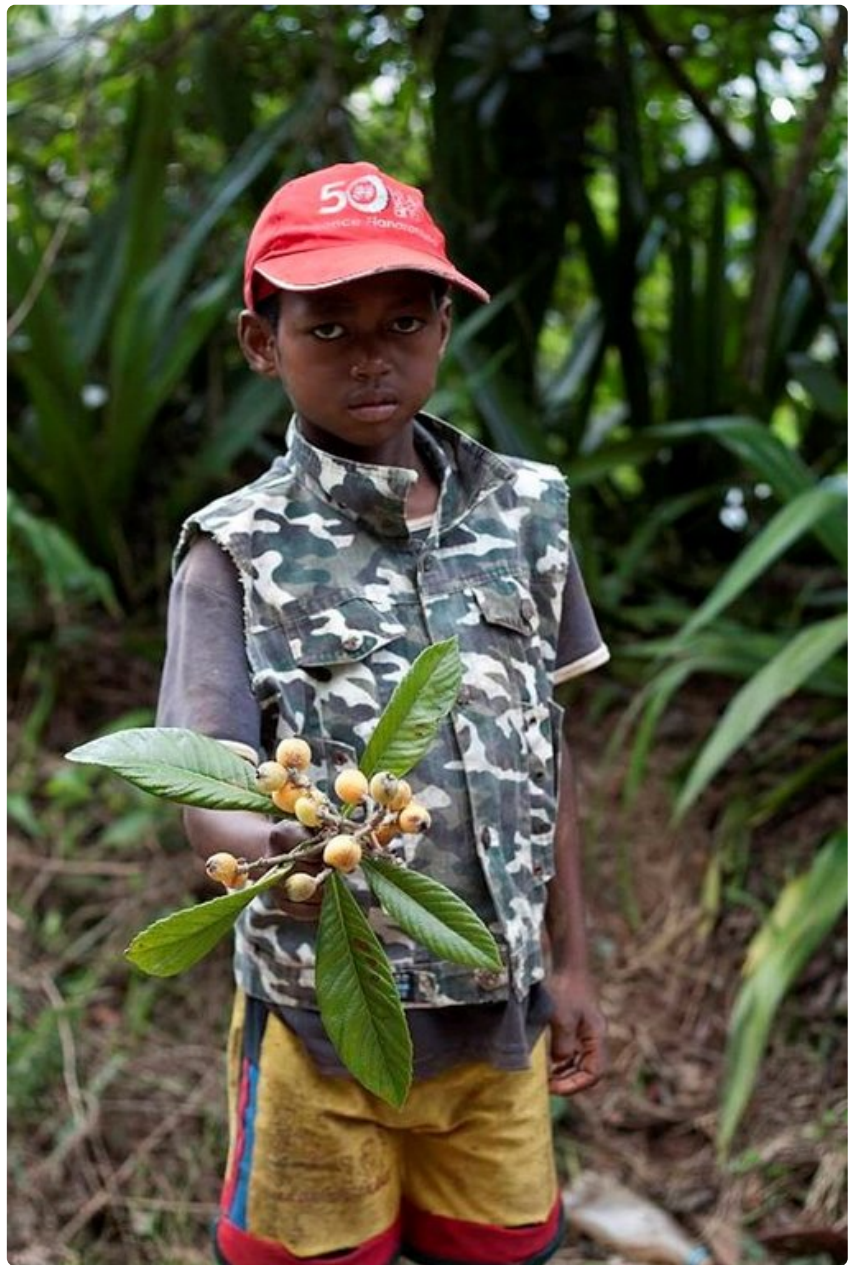
Luonnossa kasvaa paljon villihedelmiä, joista voi nauttia kuka tahansa. Fianarantsoalainen poika haki puusta tuntemattomaksi jääneitä makeankirpeitä marjoja.