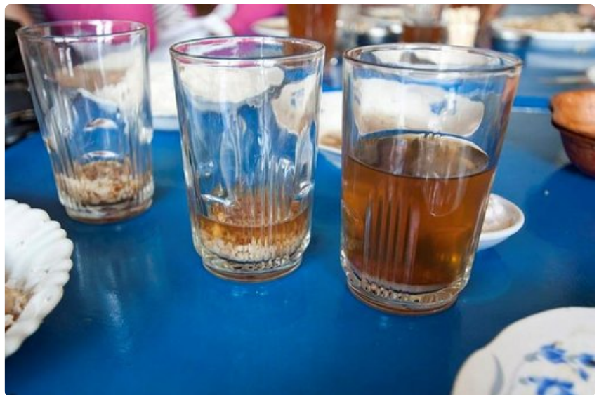
Perinteinen ruokajuoma on rano vola, eli keitettyä ja pohjaan käretytettyä riisivettä. Krämmäleet ovat osa juomaa, jota paikalliset nauttivat kaikkien ruokien kanssa.