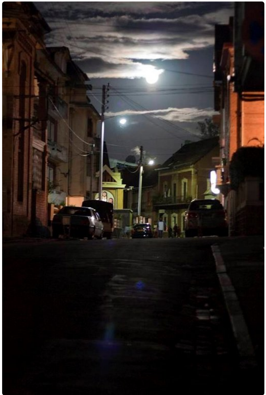
Antananarivon kaduilla ei kannata kuljettaa mukana mitään ylimääräistä, etenkin iltaisin.