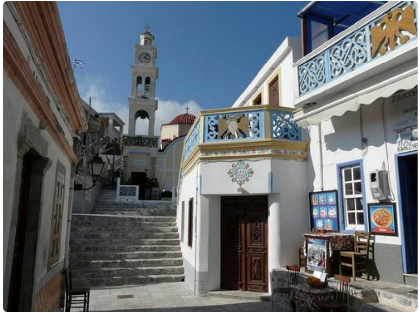
Kapea katu ja Olympóksen kirkko edessä ja ravintola-baari Parthenon oikealla.

Miehet istuskelevat väittelemässä tai pelaamassa kahvikupposen tai olutlasillisen ääressä.