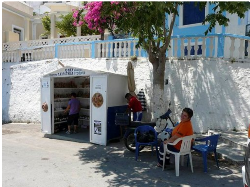
Menetésin kyläkioskissa myydään paikallisia tuotteita.