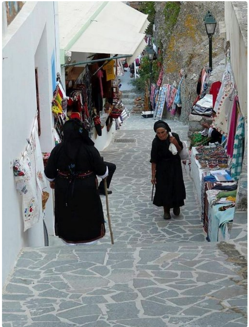
Paikalliset naiset perinteisissä puvuissaan