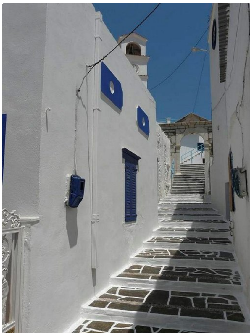
Portaat ylös Kápathoksen tunnetuimpaan kirkkoon, jota kutsutaan nimellä Kimisis Tis Thetokou, Neitsyt Marian taivaaseen astumisen kirkko.