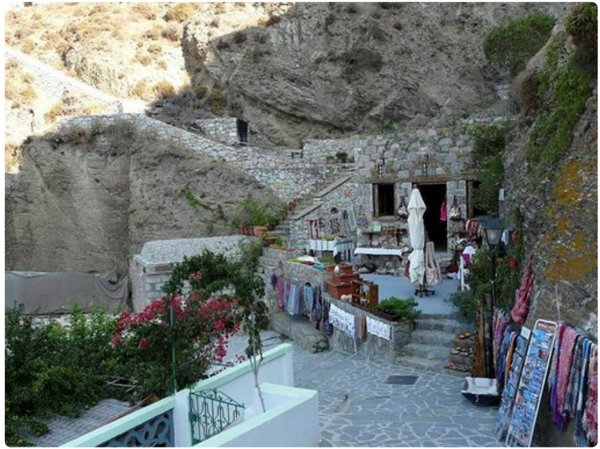
Tuotteita esillä olympökselaisessa kaupassa.