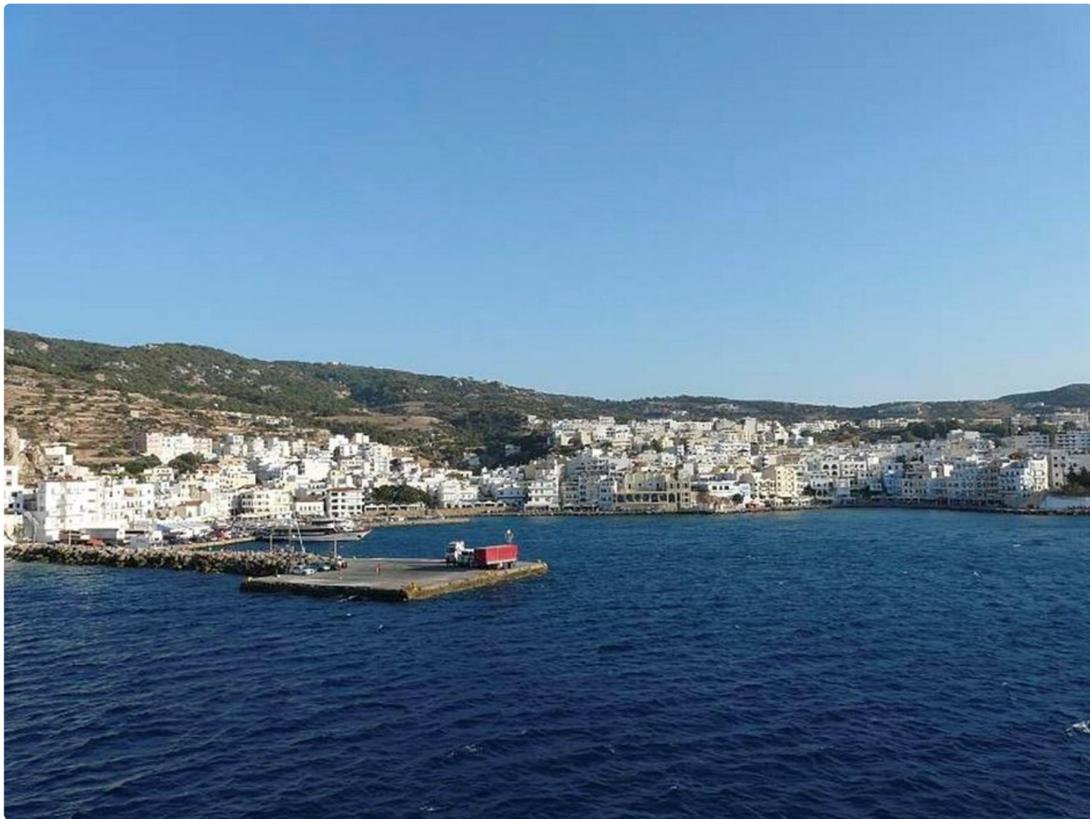
Näkymä laivalta pääkaupunkiin Pigádiaan.