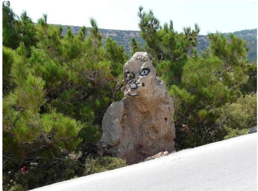
Liftari, joka on odottanut liian pitkään? Vai olisi paikallisten huumorintajua kiviveistoksen muodossa?