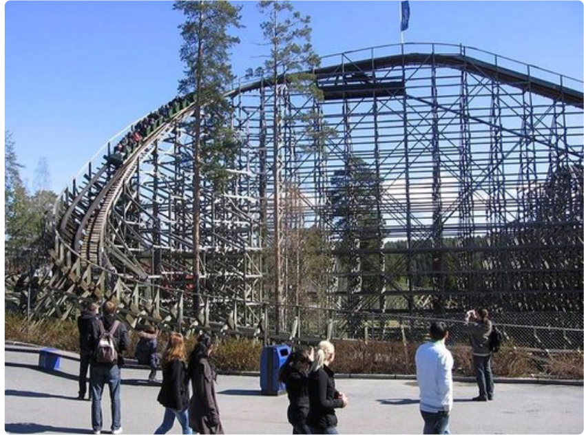
TusenFryd-huvipuiston vuoristoradan jälkeen pulssin voi tasata jossakin puiston monista ravintoloista.