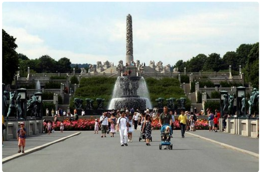
Vigelandsparkenissa on yli 200 veistosta.