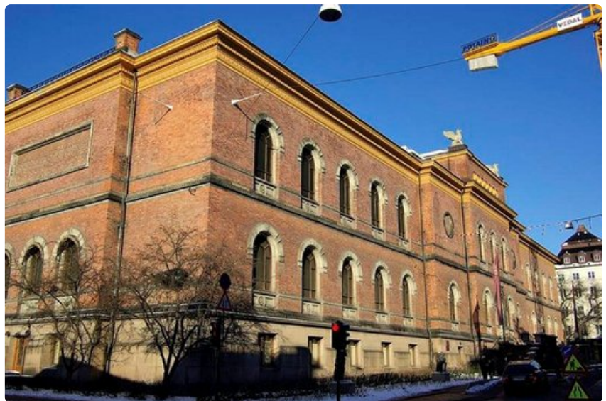
Norjan kansallismuseossa on maan suurin taidekokoelma.