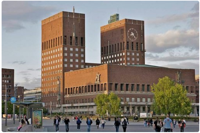
Oslo kaupungintalossa luovutetaan vuosittain Nobelin rauhanpalkinto.