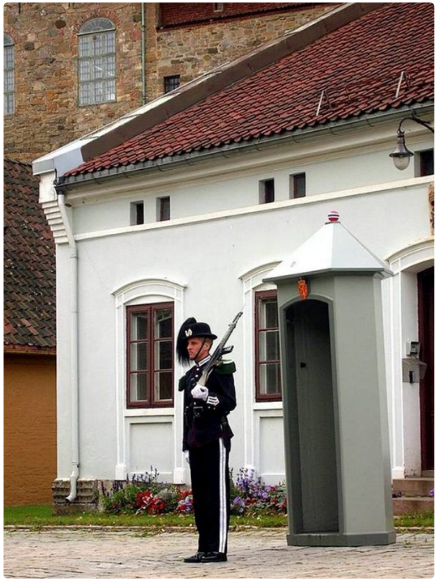
Akershusin linnan on Oslon tärkein matkailukohte.