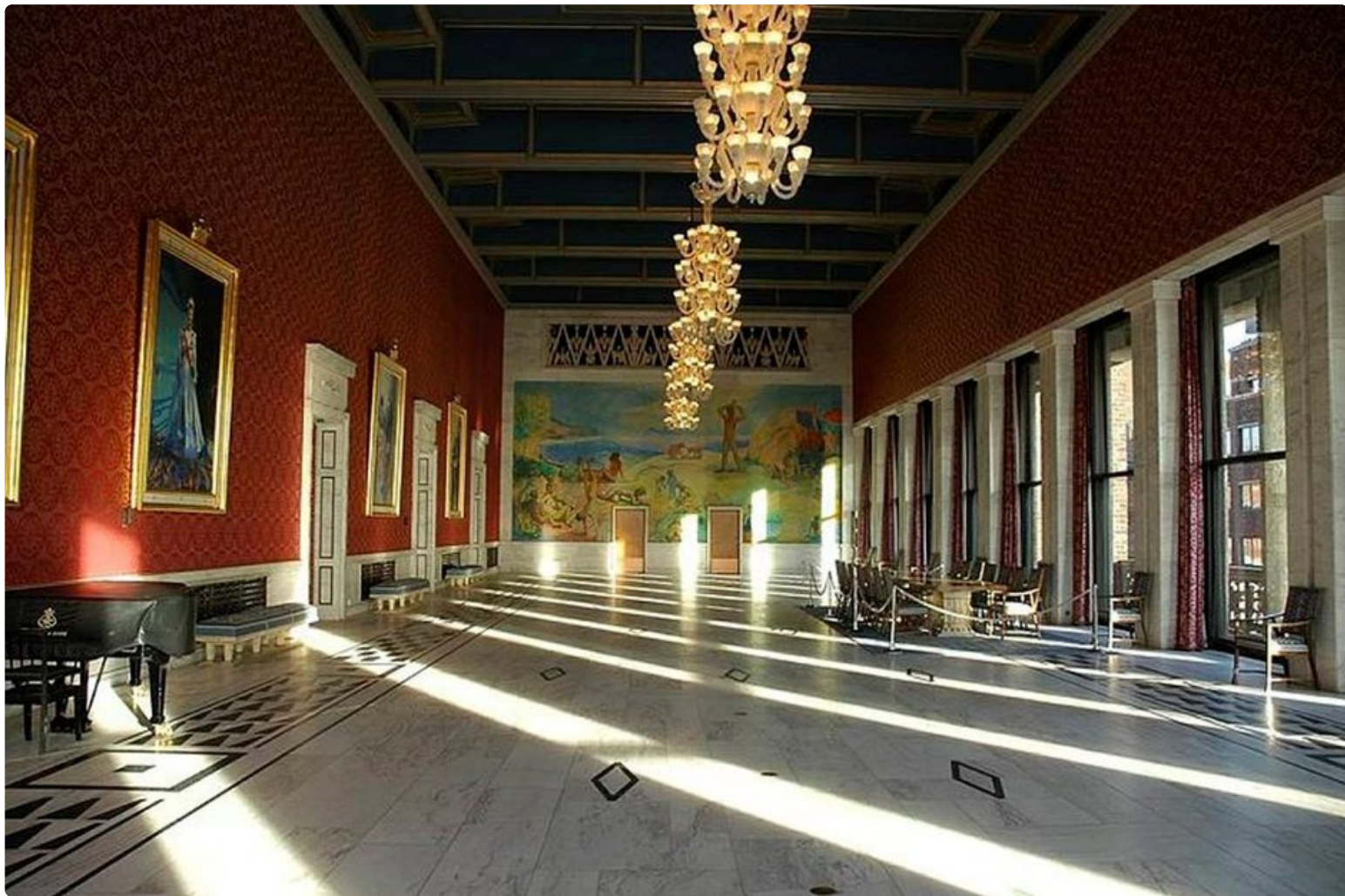
Oslo palikkamaisen kaupungintalon sisätilat ovat koristeelliset.