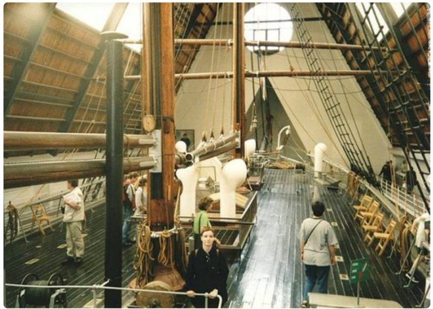
Fram-museo tarjoaa aikamatkan menneeseen.