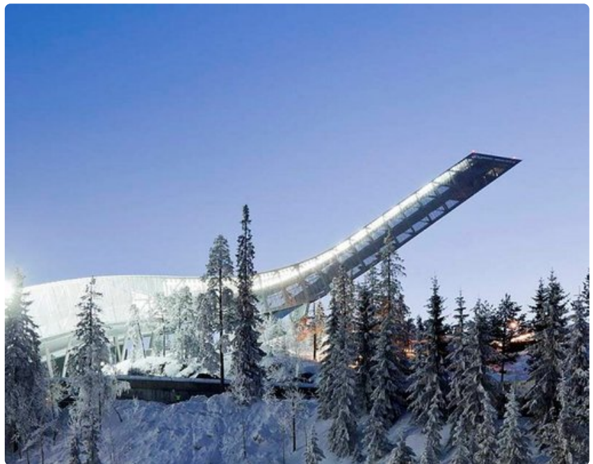
Holmenkollenin hyppyrämäki on kuin moderni veistos.