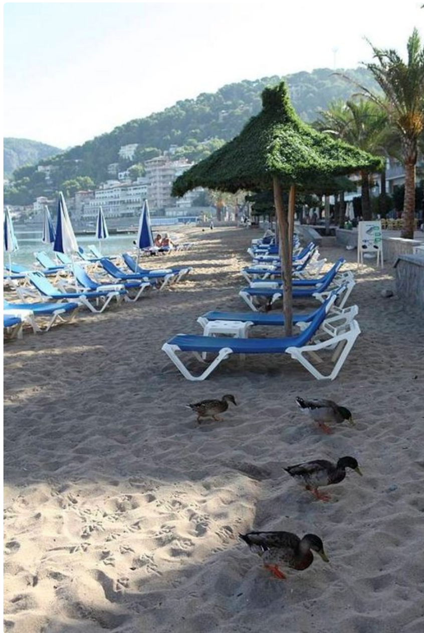
Aamuinen siivouspartio puhdistaa uimarantaa.