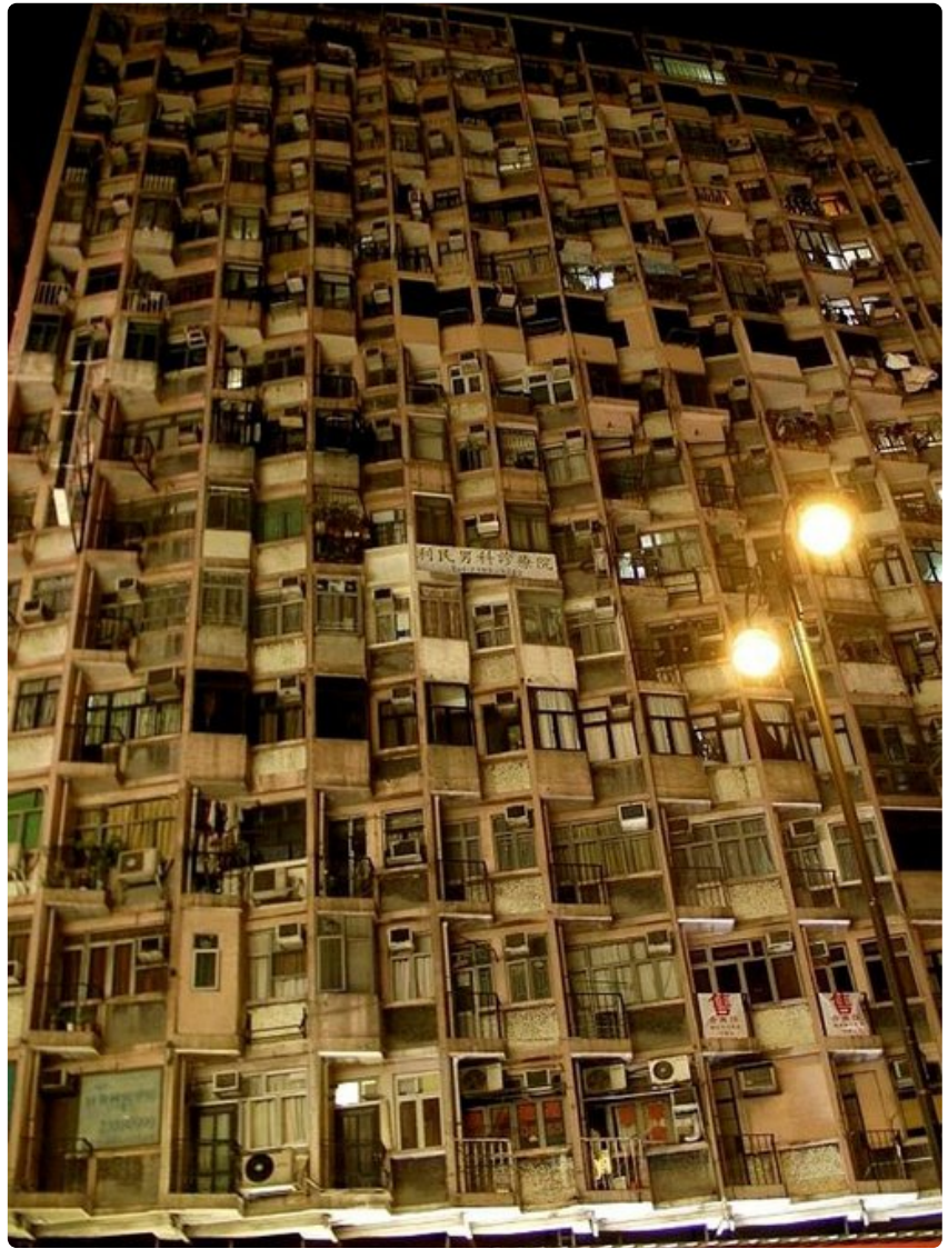
Suuri osa hongkongilaisista asuu kerrostaloissa, joista osa on jo parhaat päivänsä nähnyt.

Jos kaipuu Hongkongin vilinään käy suureksi, voi lautan napata koska tahansa noin 13 euron hintaan. Muutaman vuoden kuluttua matka taittunee myös muilla kulkuneuvoilla, sillä Hongkongin, Zhuhain kaupungin ja Macaon välille on rakenteilla 50 kilometriä pitkä siltojen ja tunnelien muodostama väylä. Maailman suurimman merisillan arvioidaan avautuvan liikenteelle vuonna 2016.