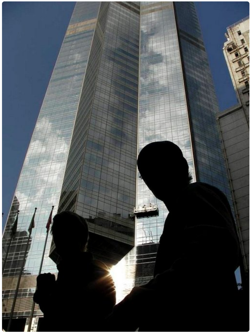
Hongkongin saaren lasisten pilvenpiirtäjien varjostamilla kaduilla riittää ihmeteltävää.