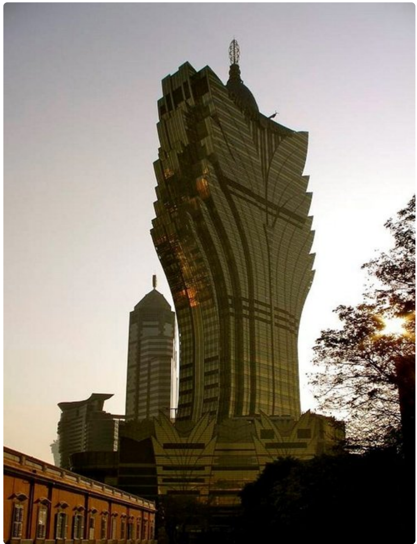
58-kerroksinen kasinohotelli, Grand Lisboa, on yksi Macaon maamerkeistä.

- Kaikki ihmisen keksimä materia löytyy täältä - ja suurin osa väärennettynä, naurahtaa kaupungissa asusteleva opiskelija pilke silmäkulmassaan ja jatkaa vakavammin, että taskuvarkaiden varalta kannattaa olla tarkkana.