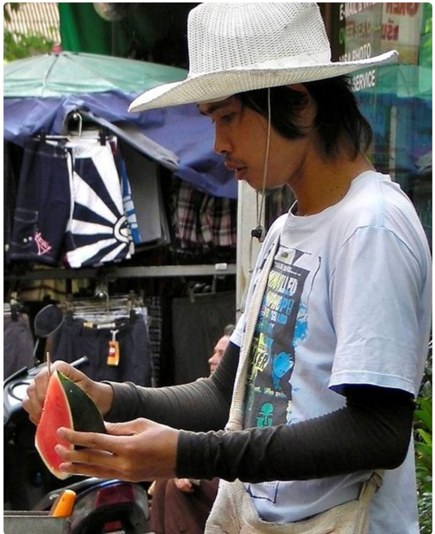
Hedelmäkauppias leikkaa vesimelonia Kowloonin kadulla.