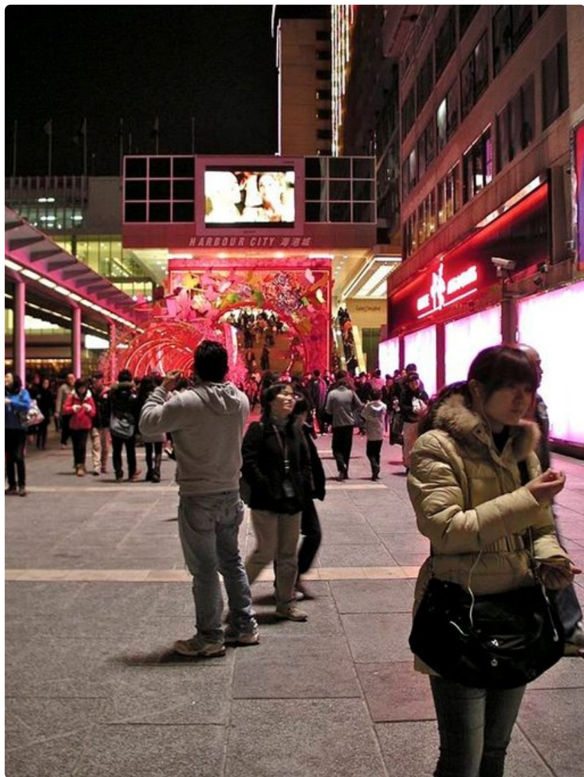
Ilta pimenee, mutta kaupunki valvoo.

Hongkongin ruokakulttuuri on saanut Kiinan ja läntisen maailman ohella vaikutteita niin Japanista kuin Kaakkois-Aasiastakin. Kaupungissa kannattaa kävellä rohkeasti sisään paikallisten suosimiin ravintoloihin, joissa saa maukkaita aterioita muutamalla eurolla. Lisäksi kulinaristista lomaa kaipaavan kannattaa harkita tutustumista myös erikoisempiin kattauksiin.