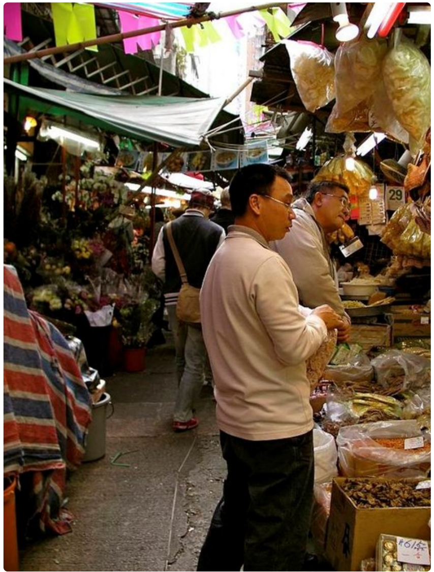
Ruokatoreilla on kiinalainen tunnelma.