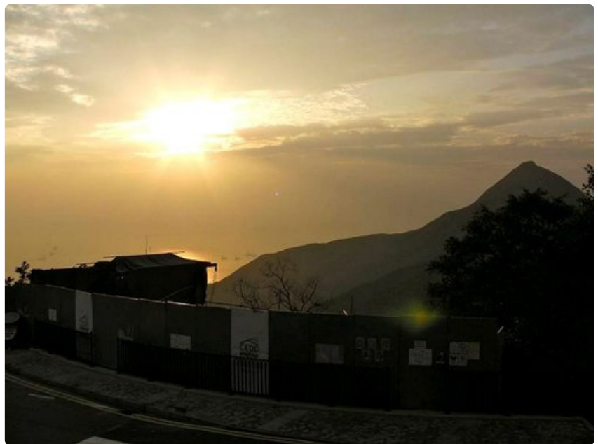
Matka Old Peak Roadia pitkin Hongkongin saaren korkeimmalle kohdalle, Victoria Peakille, tarjoaa kontrasteja.