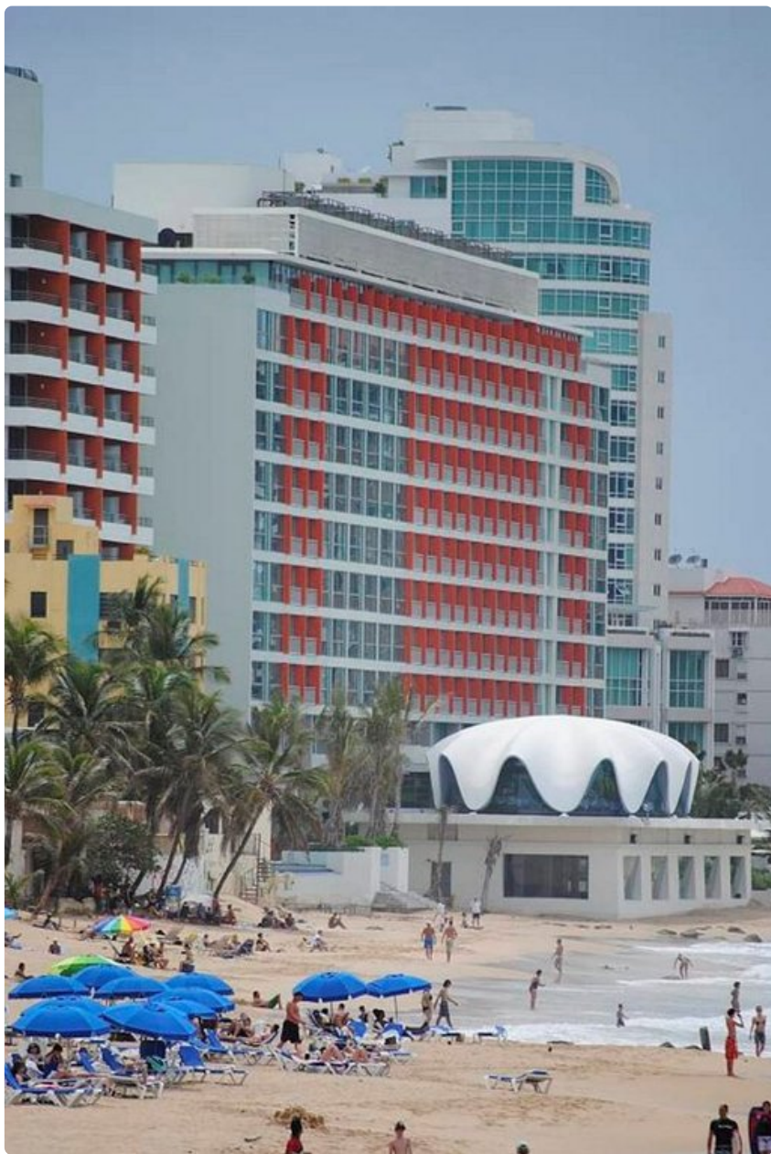
Paikallisten suosiman La Conchan rannan läheisyydessä on laaja tarjonta ravintoloita ja baareja.