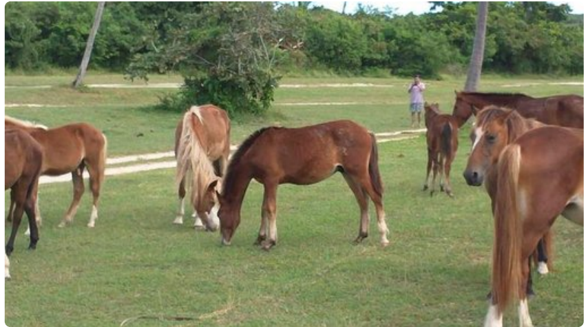
Monilla rannoilla voi nähdä hevosia käyskentelemässä.