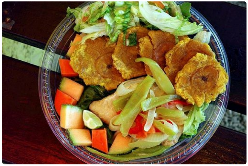
Puerto Rican ruoka on tuoretta ja varsin kalapainotteista.