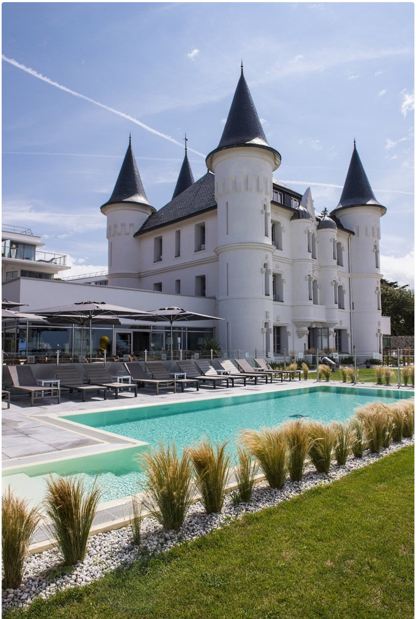
Hotel Relais Château des Tourelles majoittaa myös Zlatan Ibrahimovicin ja muut Ruotsin jalkapallotähdet