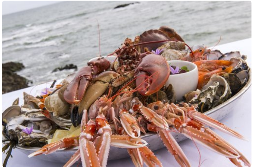
Meren antimilla on tärkeä rooli Ranskan länsirannikon gastronomiassa.