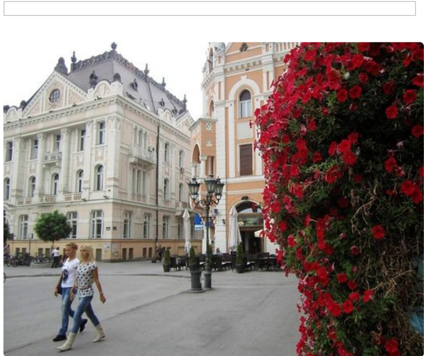
Novi Sadin keskusaukio.

Värikkäiden talojen reunustamat suloiset kadut ovat kaukana niistä mielikuvista,