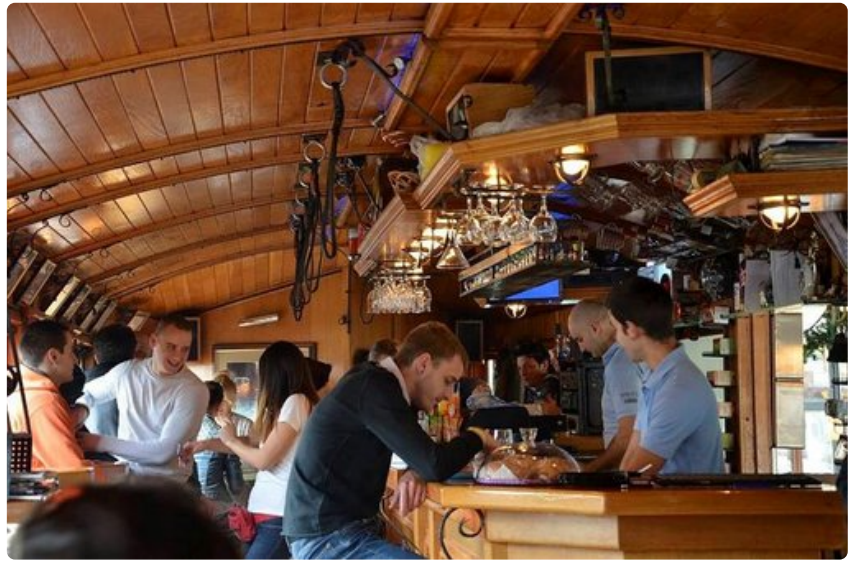
Kahviloissa riittää aina asiakkaita.