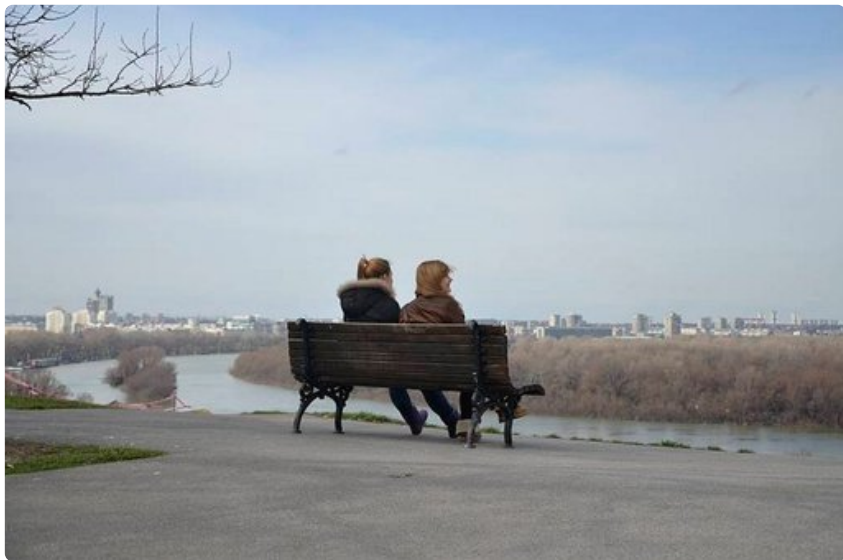
Rauhoittavat jokimaisemat Belgradin linnoitukselta katsottuna.

o Hitaat liikenneyhteydet Serbian sisällä, mutta myös muihin Balkanin kaupunkeihin. Esimerkiksi 300 kilometrin matka Belgradista Sarajevoon kestää junalla yhdeksän tuntia.