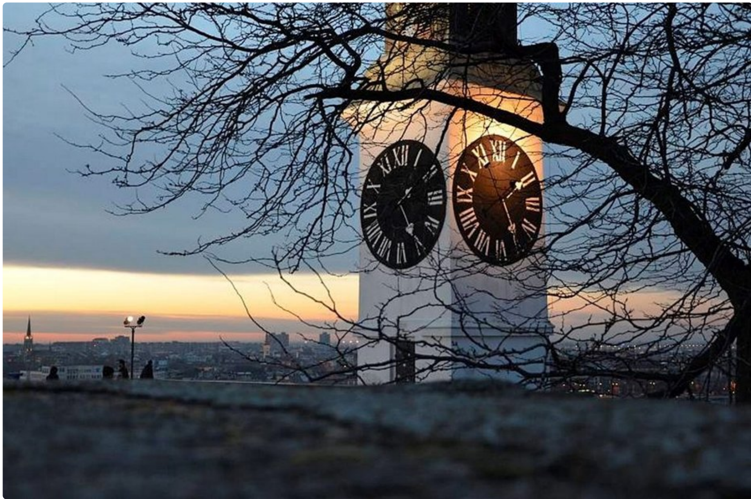
Yksi tärkeimmistä Novi Sadin maamerkeistä on Petrovaradinin kello. Sen erikoisuus on pitkä tuntiviisari ja lyhyt minuuttiviisari.