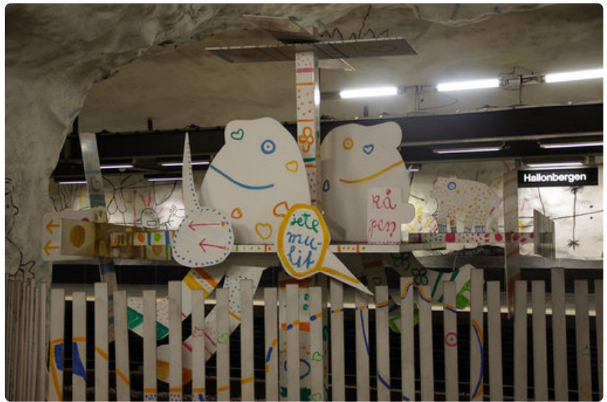
Hällönsbergenin asema