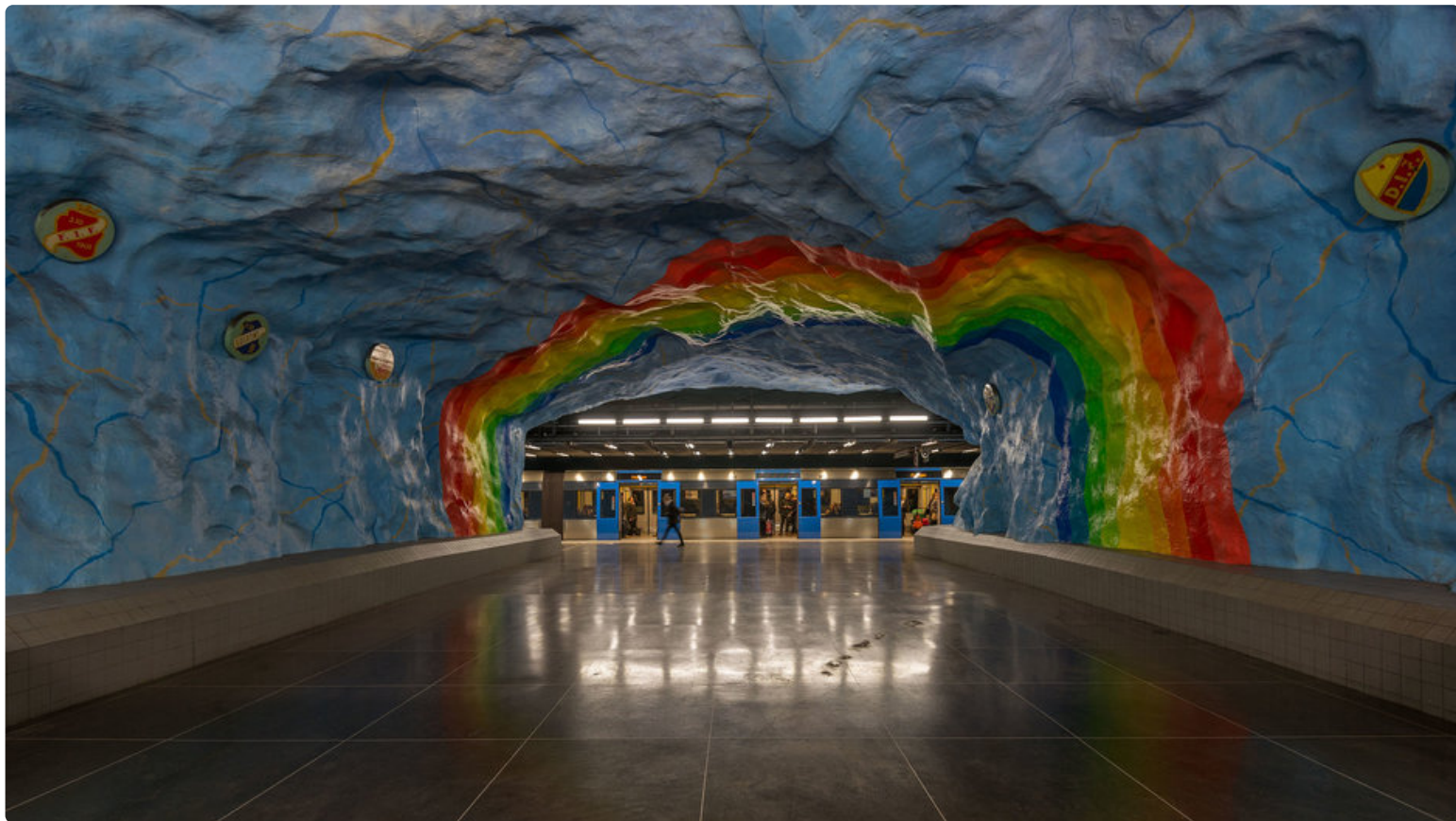
Stadionin asema