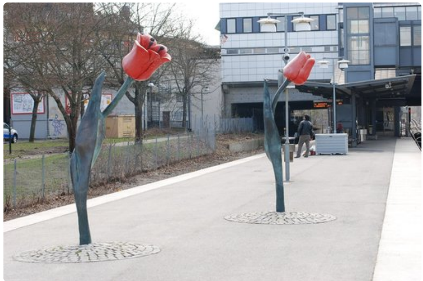
Högdalenin aseman tulppaanit.