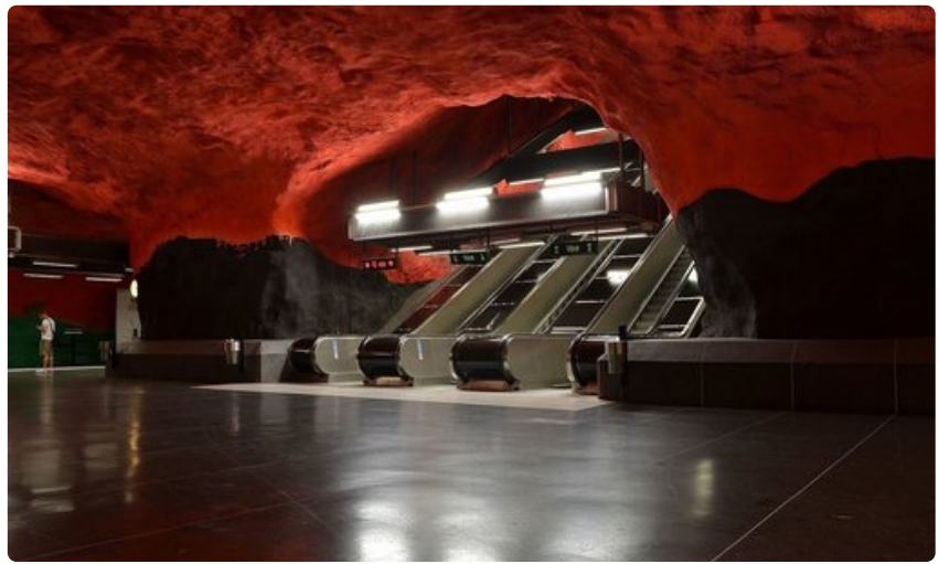
Nosta katse lattiasta, kun olet seuraavan kerran Tukholman metron kyydissä. Yhdeksälläkymmenellä asemalla sadasta on julkista taidetta. Solnan metroasema.

Tukholman teknillisen yliopiston kupeessa sijaitsevan aseman suunnittelu on ottanut mallia teknologian saavutuksista. Lennart Mörkin teosten aiheena ovat muun muassa klassiset alkuaineet.