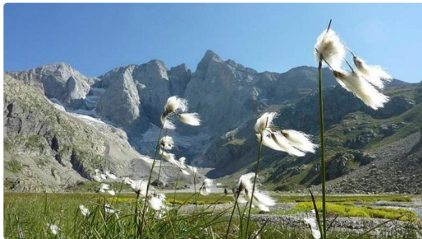
Macizo del Vignemale vuorten pohjoispuoli Oulettes de Gauven vuoristotuivasta kuvattuna (42°47'31.77" N 0°08'27.31" W).