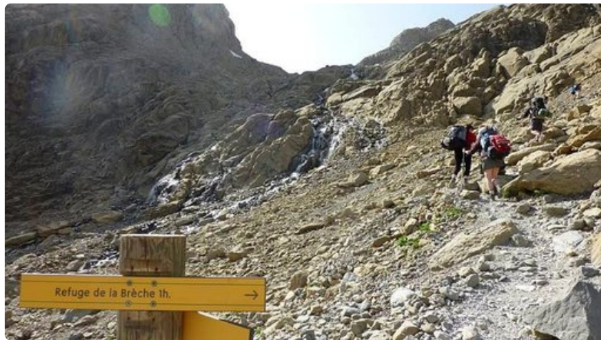
Vaeltajia tunnin matkan päässä La Brèchen vuoristotuivasta.

Varustusosuudet La Ruta de los Perdidos -reitille