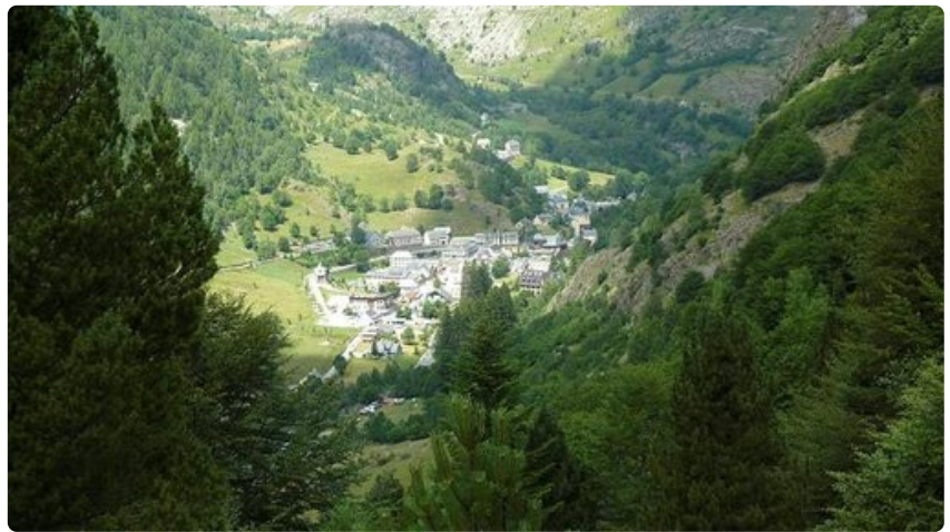
La Ruta de los Perdidos kulkee pienen Gavarnien kunnan lävitse, joka sijaitsee Pyreneiden vuoriston kätkössä.