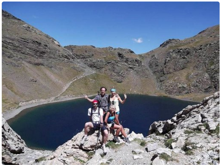
Jos suunnittelet La Ruta de los Perdidosille lähtemistä, ihanteellisinta olisi koota valmiiksi oma 4-8 henkilön vaellusporukka.