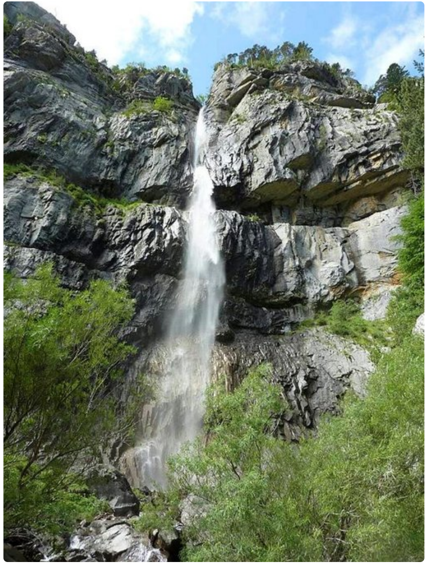
Pyreneillä vaeltavat voivat pysähtyä ihailemaan vesiputouksia ja vuoristopurojen raikkalla vedellä voi sammuttaa myös janon.