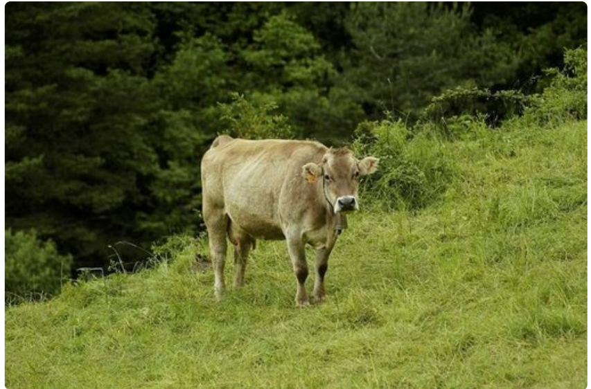
Vapaana käyskenteleviin lehtiin törmää tämän tästä Pyreneiden vuorten rinteillä