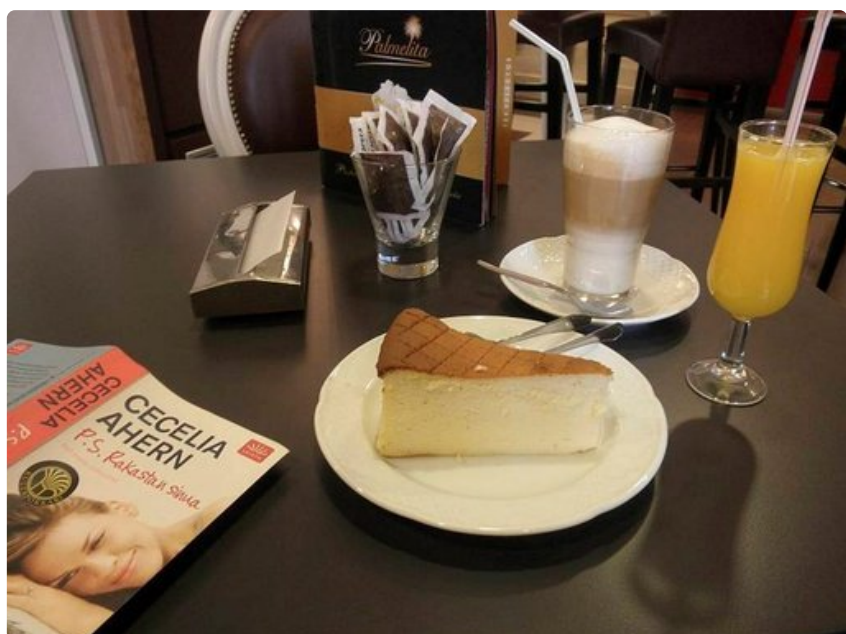
Konditorioissa maistuu juustokakku ja latte