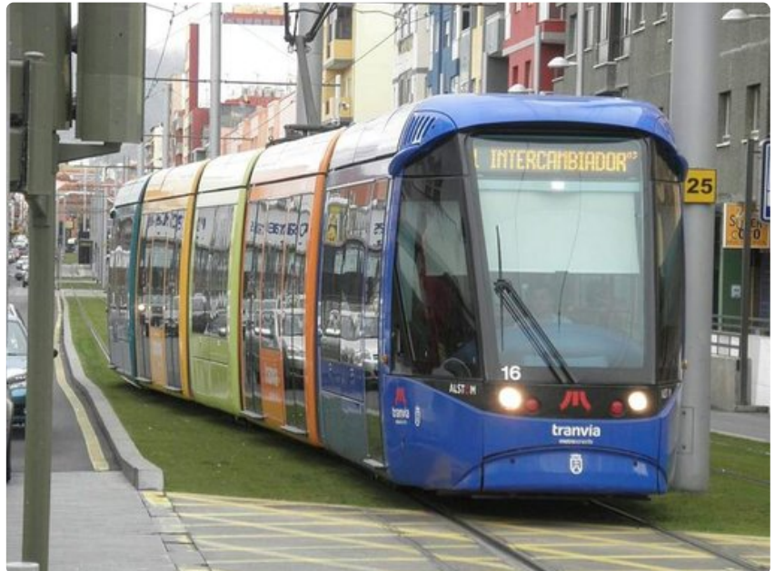
Iloinen raitiovaunu liikennöi pääkaupungista yliopistokaupunki La Lagunaan.