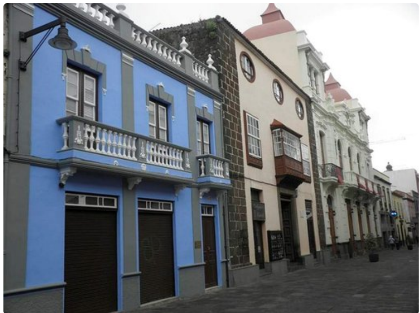
Kauniit parvekkeet ovat talojen tavaramerkki Kanariansaarilla

La Laguna sijaitsee vuorien ympäröimänä 500 metrin korkeudessa Teneriffan koillisosassa. Kaupungin perusti espanjalainen Fernandes de Lugo valloittaessaan Kanariansaaret 1400- luvun loppupuolella. La Lagunasta tuli saaren pääkaupunki vuoteen 1723 saakka. Tämänhetkinen pääkaupunki Santa Cruz oli sisämaassa sijaitsevan La Lagunan satama, mutta sai myöhemmin sijaintinsa vuoksi pääkaupungin aseman.