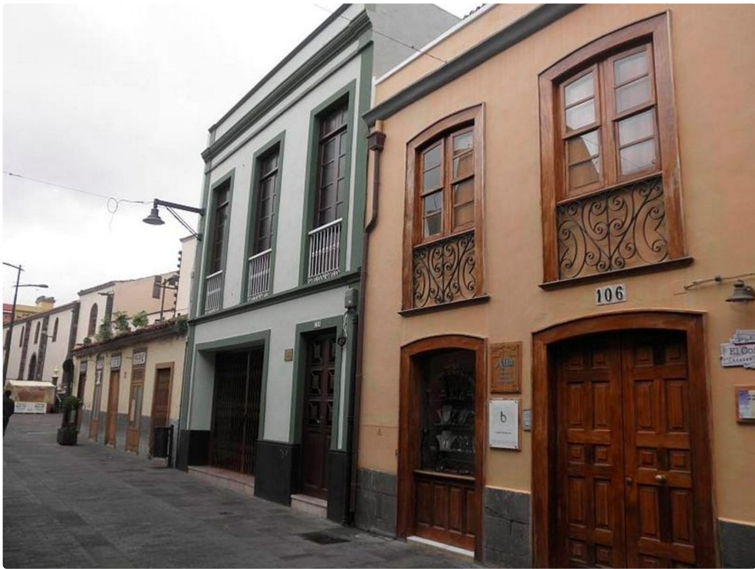
Erilaisuutta vieri vieressä