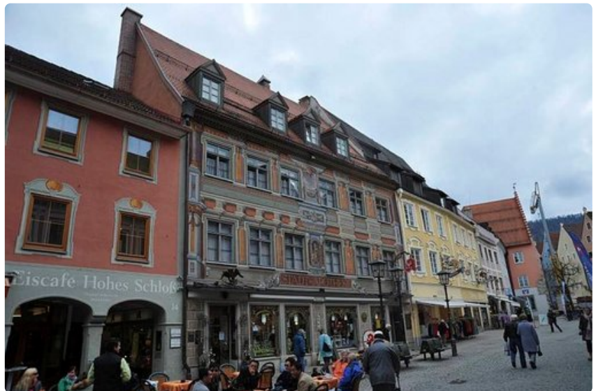
Füssenin koristeellinen apteekki.