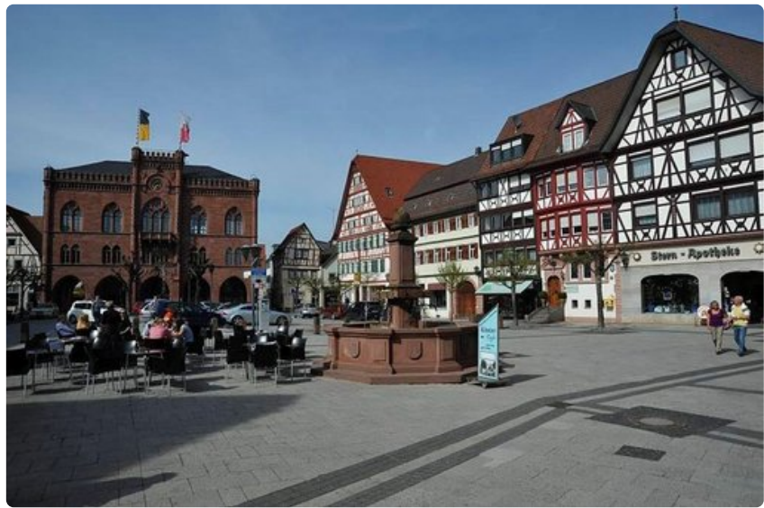
Tauberin tori sekä vanha raatihuone.

Friedberg on melko vaatimaton kylä, mutta seuraava taajama taas mitä uljain.