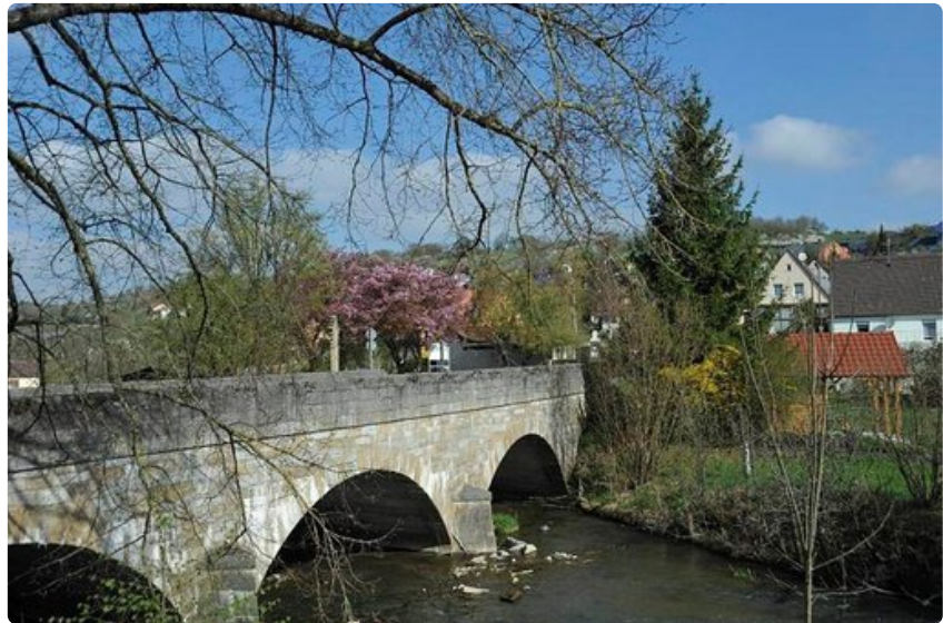
Kevään värikyläisyyttä. Vanha silta ja kirsikkapuu.