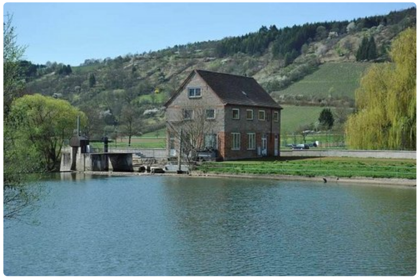
Tauber-joki. Rinteessä viinipensaita.