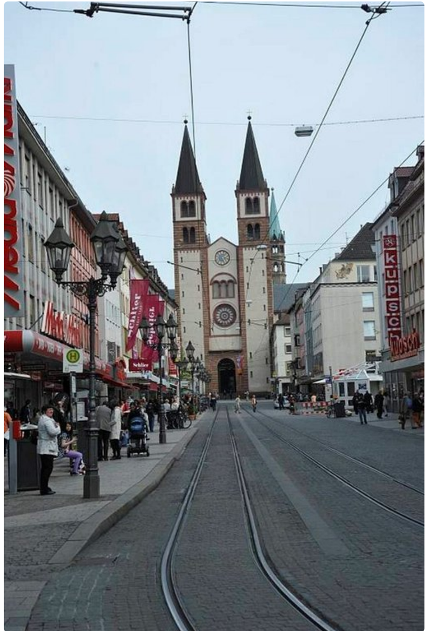
Würzburgin vanha kaupunginportti.