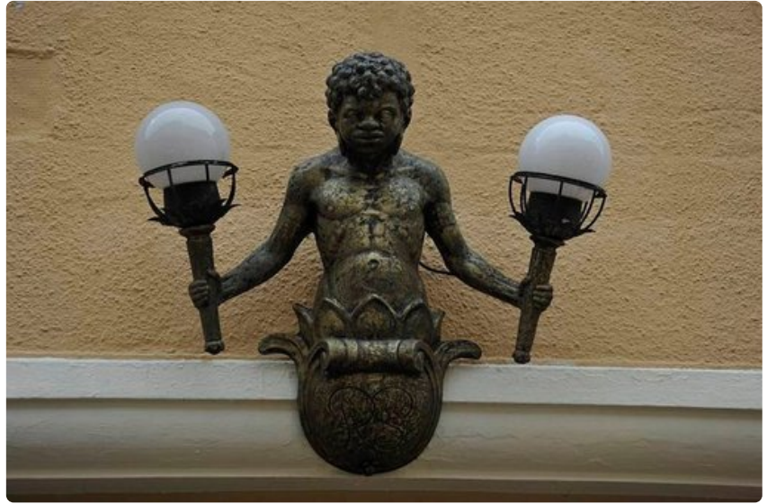
Hauska yksityiskohta. Lamppupoika Füssenissä.