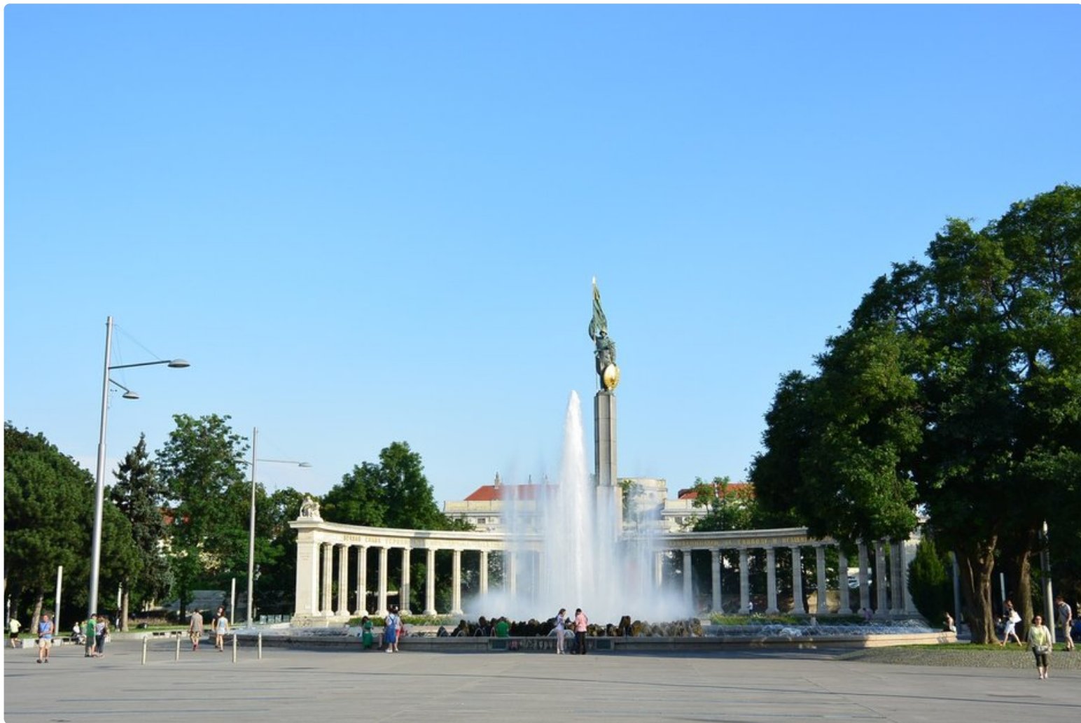
Hochstrahlbrunnenin suihkulähde Schwarzenbergplatzin aukiolla on kaupungin komein suihkulähde. Ikää sillä on reilut sata vuotta.