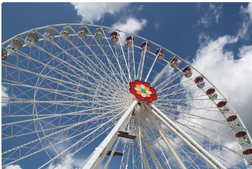
Praterin huvipuistossa asiakkaiden käytössä on sekä aivan uusia että reilut sata vuotta vanhoja maailmanpyöriä.