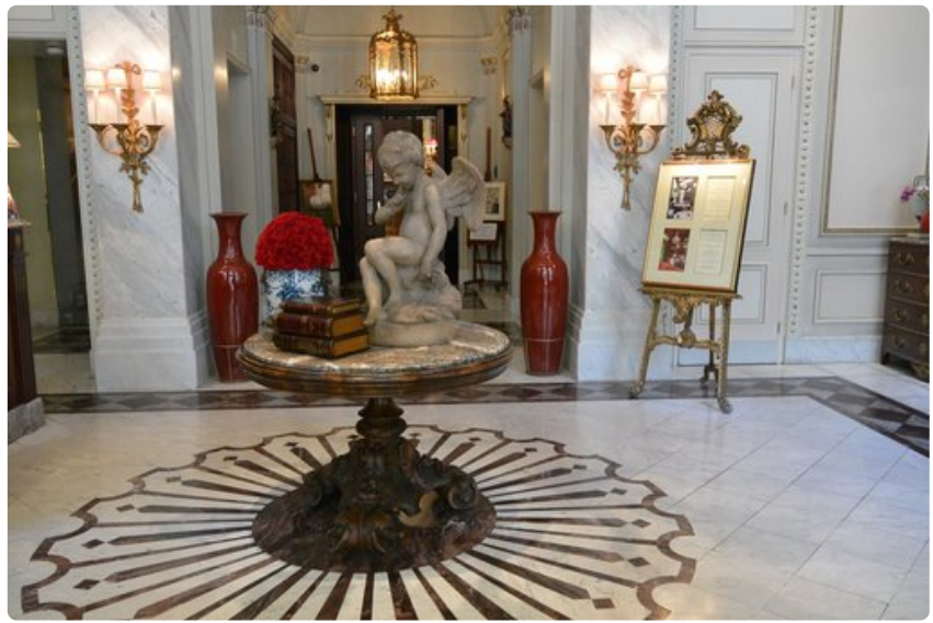
Hotel Sacherin aulan sisustus huokuu historiaa.

5. Harvest (Karmeliterplatz 1). Edullista kasvisruokaa lounas- ja päivällislistalla. Erityisen suositut keitot.