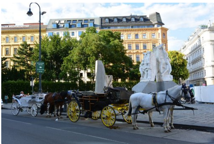
Stephansplatzin liepeiltä lähtevät hevostankurit tarjoavat leppoisaa vaihtoehtoa ydinkeskustan katseluun.