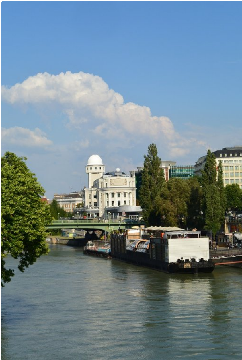
Tonavaa pitkin kulkee matkustaja-alusten lisäksi paljon tavaraliikennettä.