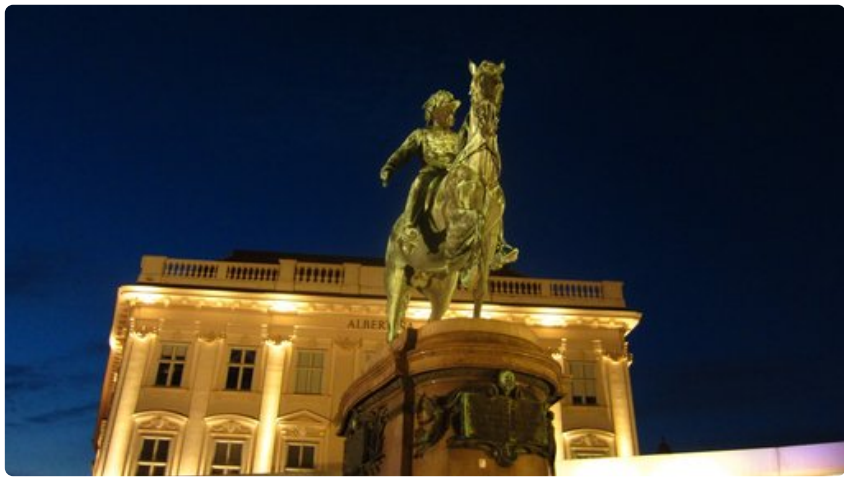
Itävallan arkkiherttua Albertin ratsastajapatsas tervehtii jylhästi Albertina-museon vieraita.

Wienin kaupunkikuvaan erottamattomasti kuuluva Riesenrad on nähty monissa elokuvissa, mukaan lukien James Bond -sarjaan kuuluvassa 007 vaaran vyöhykkeellä .