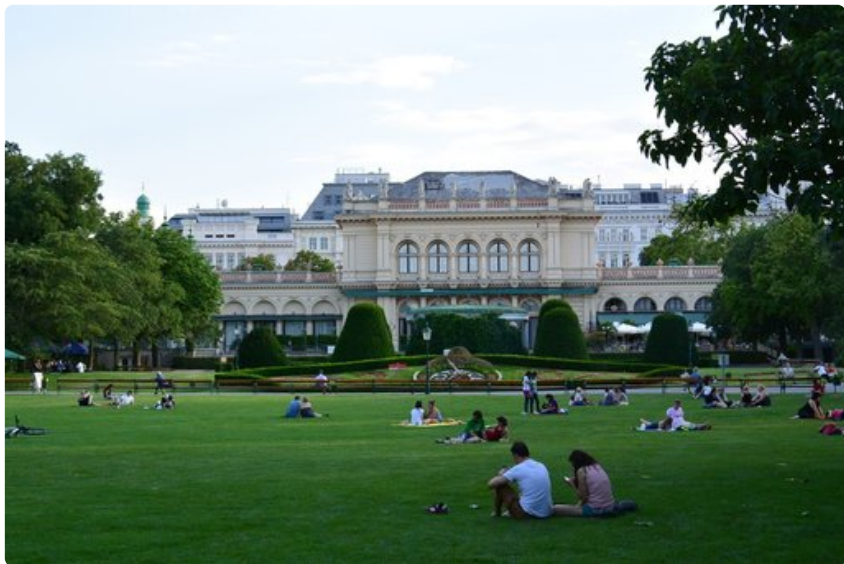
Puistoissa viihtyminen on Wienissä suosittua ajanvietettä.

Sotahistoriasta kiinnostuneille kaupungissa riittääkin nähtävää, olihan itävaltalaisyyntyinen Adolf Hitler kiinnostunut vanhan kotikaupunkinsa kehittämisestä ja suojelusta. Toisen maailmansodan aikana rakennetuista Wienin FLAK-ilmatorjuntatorneista kummatkin kaksi ovat edelleen pystyssä. G- ja L-torneiksi nimetyt teräsbetonikolossit löytyvät Augartenin puistosta (Arenbergpark). Tornien alta löytyvät niin ikään sodan varalle suunnitellut suuret pommisuojat.