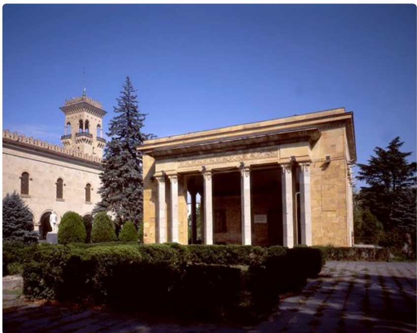
Stalinin lapsuudenkoti Georgian Gorissa on panssaroitu kivikuorella. Jättiläismuseo rakennettiin Stalinin kuoleman jälkeen ja siellä on satoja Stalinin käyttämiä esineitä ja häneen liittyviä dokumentteja.