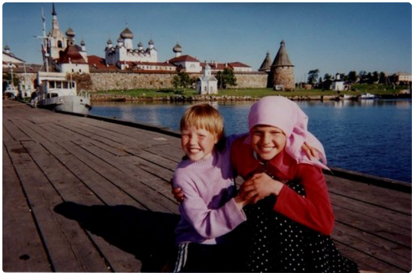
Solovetskin munkkiluostari perustettiin vuonna 1429, mutta Stalin muutti sen tosinajattelijoiden vankilaksi 30-luvulla. Sen jälkeen vankiloita nousi kuin sieniä sateella kautta Siperian.

Vuoteen 1938 mennessä viisi prosenttia kaikista kansalaisesta oli pidätetty, ja kaikki elivät jatkuvassa pelossa. Ei ihme, että Stalin käytti luodinkestäviä liivejä, ja matkusti luodinkestävässä autossa.